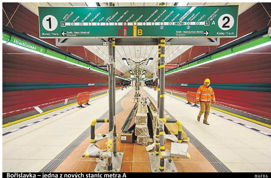
Bořislavka – jedna z nových stanic metra A