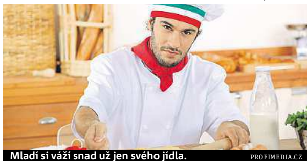
Mladí si váží snad už jen svého jídla.

na štíru s tím, aby porozuměli textu,“ tvrdě kritizuje 65letý Marazzini svoje krajany. „Důvodem, proč je Itálie tak otevřená cizím vlivům, je často nedostatek dobrých znalostí vlastní historie a jazyka,“ dodává Marazzini. „Kromě jídla, a dokonce i u něho je to méně než dříve, je italský občan často jakýmsi druhem osoby bez státní příslušnosti,“ tvrdí lingvista. ČTK