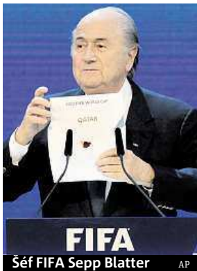
Šéf FIFA Sepp Blatter

Zahajovací zápas šampionátu se má v Kataru odehrát 26. listopadu, finále je zatím naplánováno na 23. prosince, tedy den před Vánoce.