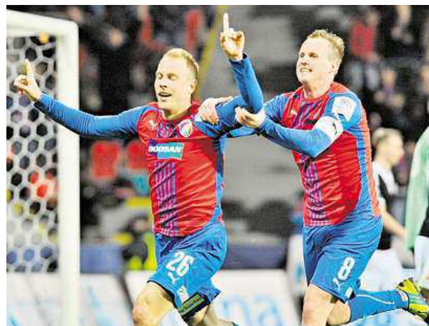
Od příští sezony má být fotbalová liga řízena kluby. ČTK

Například Komise rozhodčích však musí podle mezinárodních řádů zůstat pod národní asociací. Kluby však v ní chtějí mít zástupce. Další komise už legislativa nelimituje. PAVEL URBAN a iDNES.cz