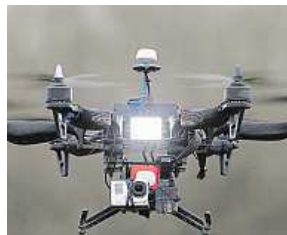
Kdo je řídí?

Nejefektivnější zbraň proti malým létajícím strojům jsou prozatím lovecké brokovnice.