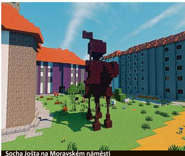
Socha Jošta na Moravském náměstí