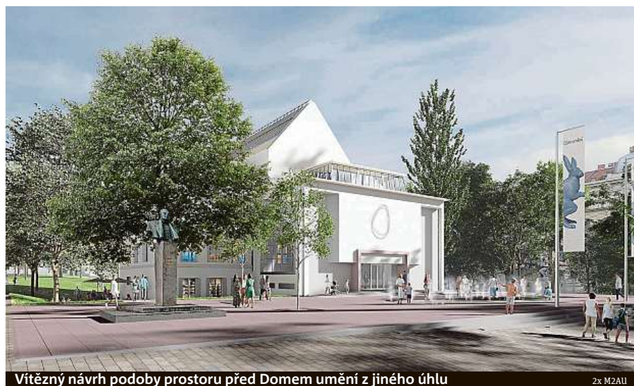
Vítězný návrh podoby prostoru před Domem umění z jiného úhlu