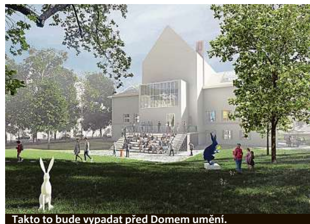
Takto to bude vypadat před Domem umění.

V současné době nelze odhadovat, kdy by mohla samotná realizace začít. Předpokládané náklady na úpravu činí dle vítězného návrhu přibližně 79 milionů korun. Všechny soutěžní návrhy si veřejnost bude moci prohlédnout na výstavě v Domě pánů z Kunštátu v průběhu března. RADEK BABIČKA