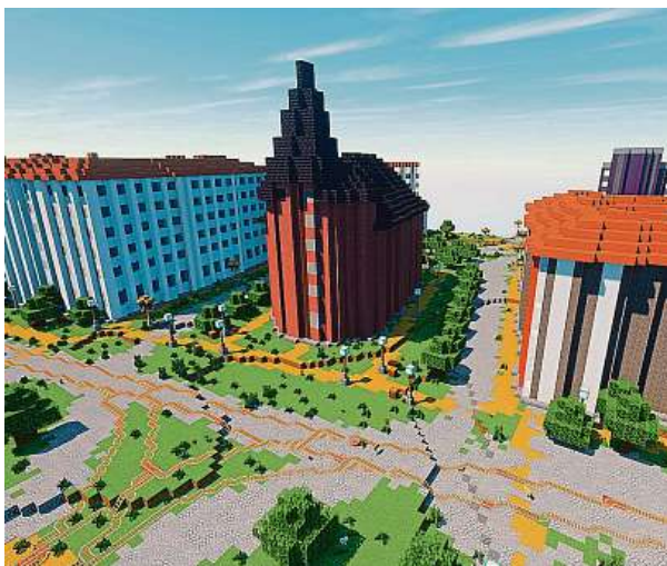
Brno je v počítačové hře Minecraft převedeno do známého kostičkovaného prostředí. Na snímcích pohled na Petrov.