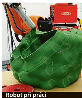
Robot při práci

Loňský rok se nesl ve znamení oslav 200 let od narození zakladatele genetiky Gregora Johanna Mendela. Jedním z posledních příspěvků k tomuto jubileu se stalo unikát-