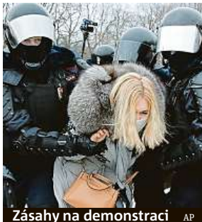
Zásahy na demonstraci

Při demonstracích na podporu ruského opozičního předáka Alexeje Navalného zasahovala policie.