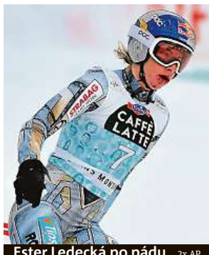
Ester Ledecká po pádu

Ester Ledecká tentokrát zavodila ve švýcarském středisku Crans Montana na lyžích. V pátek byla druhá ve sjezdu a popáté v kariéře vystoupila ve Světovém poháru na stupně vítězů. Na zkrácené trati nestačila jen na Italku Sofii Goggiaovou. O den později ji čekal další sjezd, který ovšem nedokončila. V užší pasáži ve spodní části trati skončila ve více než stokilometrové rychlosti v ochranných sítích.