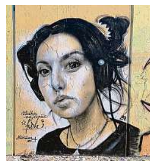
Umění v Praze 12 2x T. PODAŘIL