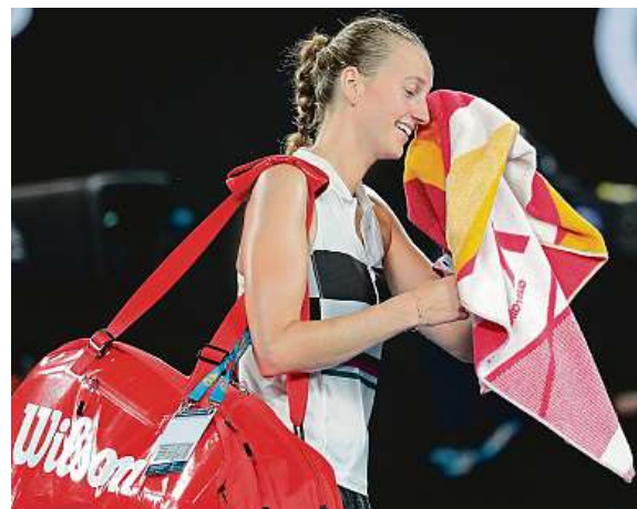
Kvitová ve druhém setu nadělila soupeřce „kanára“.

První vzájemný zápas dvojnásobné šampionky Wimbledonu Kvitové a loňské královny US Open Ósakaové bude zítra zároveň duelem o post světové jedničky. SIM a ČTK