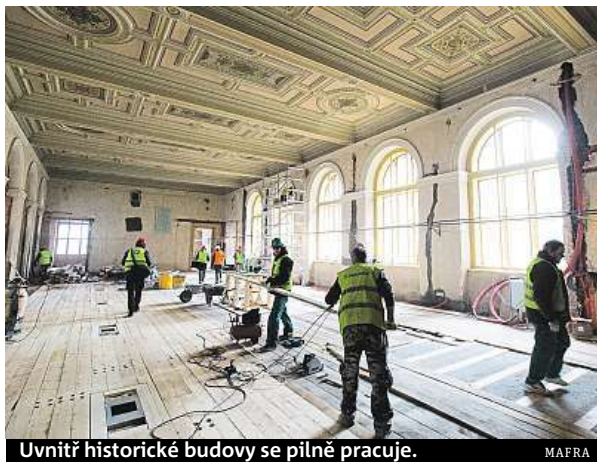
Uvnitř historické budovy se pilně pracuje.

Místo sbírek je v expozicích lešení a prach, místo vědců a kurátorů v budově pracují dělníci a na střechách místo holubů sedí restaurátoři a obnovují sousoší, zašlá smogem nebo střelbou sovětských okupantů. Historická budova Národního muzea je v polovině náročné generální rekonstrukce, první v její století a čtvrt dlouhé historii. Hoto-vo má být už příští rok, 28. říj- na 2018 se zde u příležitosti sto let republiky otevře spo- lečná výstava českého a slo- venského Národního muzea. Objekt se sice otevře, ale kromě výstavy bude většina exp- o- zic otevírána postupně do půlky roku 2020.