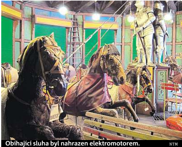
Obíhající sluha byl nahrazen elektromotorem. NTM

„Bohužel to dneska už asi takto nepůjde. Byla to odrostlá hříbata poražená na jat-