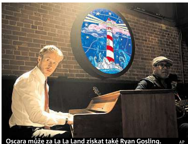
Oscara může za La La Land získat také Ryan Gosling.

Na rozdíl od předchozích dvou ročníků filmových cen, kdy byli organizátoři kritizováni za „příliš bílé Oscary“,