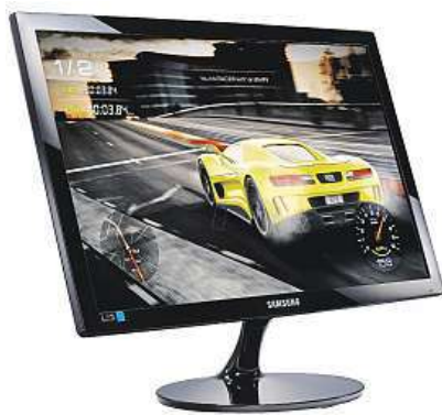
Vaše oči na tomto monitoru chrání Flicker Free. MIRONET

V rychlých akčních scénách to znamená plynulejší zobrazení bez sebemenšího zpoždění či náznaku rozmazání. Hráči díky tomu navíc získávají možnost rychlejší reakce a v případě střelček i větší šanci na přesnější zaměření nepřítele.