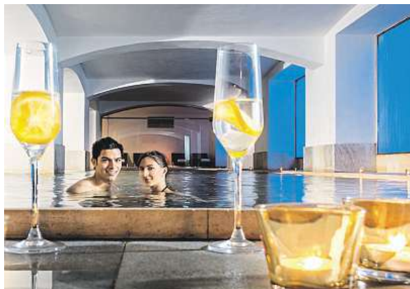
V Praze najdete i dvacetimetrový vyhřívavý bazén. BOSCOLO SPA

Veřejnosti jsou přístupné i lázně hotelu Four Seasons. „Mimohoteloví hosté mají přístup do sauny a bazénu pouze v případě, že si rezervují jedno z nabízených ošetření,“ upřesňuje podmínky vstupu do lázní Ava Spa Martina Vá-