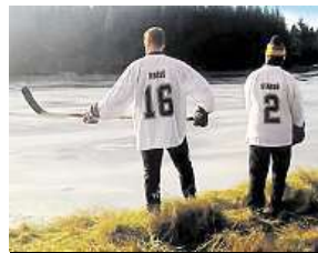
K tréninku je třeba mráz.

Máme československý hokejový tým a hrajeme Pražskou ligu ledního hokeje. Všechny nás prostě spojuje láska k hokeji, bez ohledu na národnost. V momentě, kdy