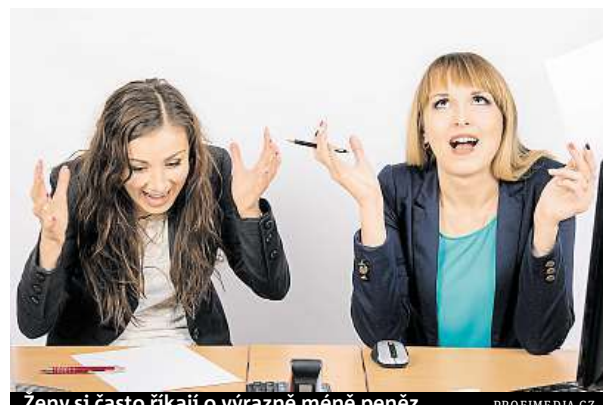
Ženy si často říkají o výrazně méně peněz.

2. Sebevědomí: Ženy berou o něco méně, i když pracují na stejných pozicích jako muži. Firmy se často řídí tabulkami pro odměňování. Avšak nepracují s pevnou sazbou, ale s rozpětím, které může být překvapivě velké. „Když se pak uchazečů o práci