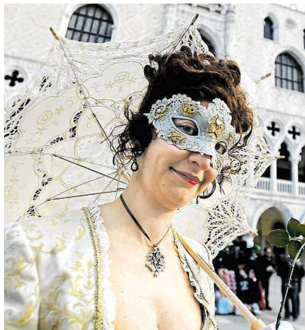
Maskovaná žena jde na zahájení benátského karnevalu. AP

Francie a Velká Británie v létě podepsaly dohodu, která zavázala Francii zvýšit počet policistů v Calais, Londýn měl zase poskytnout několik milionů liber na nová bezpečnostní opatření. ČTK