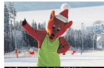
Průvodcem akcí je lišák Fox.