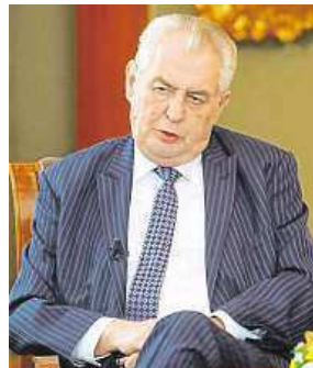
Prezident Miloš Zeman

Komiks podle prezidenta svým způsobem zjednodušuje situaci. Součástí projektu, vytvořeného podle švédského vzoru, je komiksový příběh chlapce Hamída, který se vydává na cestu z Afghánistánu do Švédska. Třináctiminutový film dětem vypráví příběh