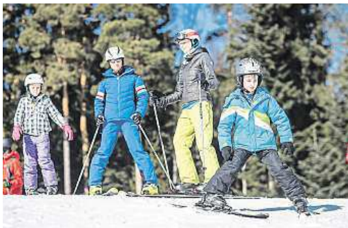
Děti se tady naučí bez problémů lyžovat, připraveny jsou také nejrůznější akce.

Vyzkoušet si můžete bobovahu nebo si udělat vý-