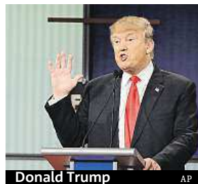
Donald Trump

Favorit na republikánskou nominaci do boje o Bílý dům Donald Trump si bezmezně věří. Na předvolebním setkání v americkém státu Iowa prohlásil, že by mohl na rušném bulváru v srdci New Yorku „někoho střílet“, a neztratil by prý ani jednoho voliče. ČTK