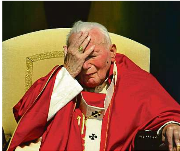
Jedním ze slavných, kterým Parkinsonova nemoc komplikovala život ve vysokém stáří, byl papež Jan Pavel II.

Žijete ve městě, nebo na venkově? Jste-li vesničan, tak jste určitě zdravější. Vzduch, les, klídek. Z pohledu lékaře neurologa to ale vypadá jinak. Pokud například farmaříte, je teoreticky možné, že nějaké neurodegenerativní onemocnění vás postihne spíše mimo velkou aglomeraci.