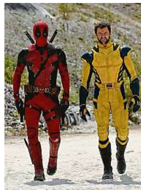
Zleva: R. Reynolds a H. Jackman na place Deadpoola 3

Absenci velkých hráčů v příštím roce naopak naplno