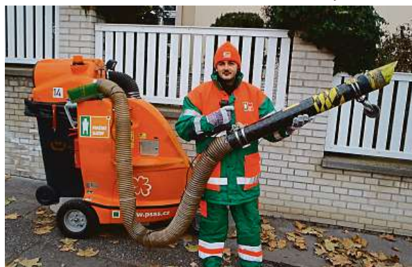
Úklid jsme si před lety zkusili také. Nejvíce listů uklízeči seberou ve vilových čtvrtích jako Ořechovka, Hanspaulka nebo Hostivař. MET

Vídeň každoročně vyprodukuje kolem padesáti tisíc tun kompostu. Městští zahradníci jej denně používají, ale radnice ho nabízí i obyvatelům. Ti si mohou v jednom ze třinácti sběrných dvorů bezplatně vyzvednout až půl kubíku kompostu. Část materiálu Vídeň používá k výrobě bezrašelinové půdy, kterou také nabízí ve sběrných dvorech. „Listoví spadlé na silnice a znečištěné emisemi ze silničního provozu Vídeň sbírá sepa-