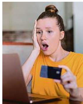
Pozor, kam a komu zadáváte údaje z karty.

V poslední době se množí případy, kdy se podvodníci zaštiťují jmény všeobecně známých firem. Obrana je snadná: nikdy neklikejte na přílohy v podezřelých e-mailech. Nikdy neposílejte své plateb-