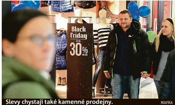
Slevy chystají také kamenné prodejny.

Přestože současná energetická krize nabádá spíše k šetření, výrazné slevy, které budou obchodníci od pátku do pondělí nabízet, k výhodným nákupům kdekoho zlákají. Podle odborníků by si však lidé měli dát pozor na nekalé praktiky podvodníků. „Nejčastěji pozorujeme snahu podvodníků okrást lidi