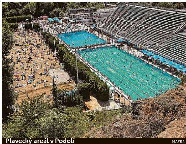
Plavecký areál v Podolí

„Stávajícím zpřesněním jsou zastropovány i sportovní spolky zapsané v rejstříku sportovních organizací Národní sportovní agentury. Znamená to, že areály České unie sportu – Plavecký sta-