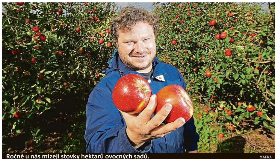
Ročně u nás mizejí stovky hektarů ovocných sadů.

Česká republika přišla od roku 1989 o více než čtyřicet procent plochy ovocných sadů. Jen letos zmizelo téměř šest set hektarů.