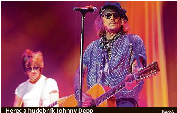
Herec a hudebník Johnny Depp