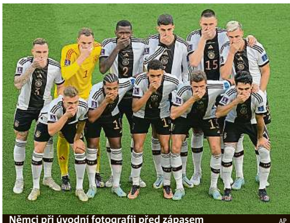
Němci při úvodní fotografii před zápasem

Chorvatsko předtím ve skupině F v Chúru remizovalo s Marokem 0:0. „Bylo to náš první zápas v Kataru. Teď to pro nás určitě bude snadnější a budeme hrát lépe. Nepřijeli jsme to sem jenom odehrát,“ řekl po zápase kapitán Chorvatů Luka Modrič.