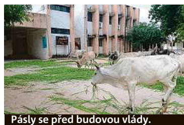
Pásly se před budovou vlády.

Letos v Gudžarátu podle úředních údajů 170 tisíc krav onemocnělo nodulární dermatitidou, což je nebezpečná virová nákaza, která se vyznačuje vznikem boulí na kůži a různých částech těla. Více než 5800 zvířat uhynulo. ČTK