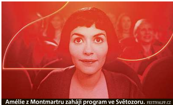
Amélie z Montmartru zahájí program ve Světozoru. FESTIVALFF.CZ

Festival bude dnes slavnostně zahájen v kině Lucerna předpremiérou animovaného snímku Mikulášovy patálie: Jak to celé začalo, který získal hlavní cenu na letošním festivalu animovaného filmu v Ancey. Kultovní film Amélie z Montmartru zahájí festival v podvečer v kině Světozor, večerní projekce zde bude patřit snímku režisérky Maryam