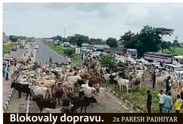
Blokovaly dopravu. 2x PARESH PADHIYAR

V důsledku těchto pravidel se po ulicích potuluje dobytek, jenž způ-