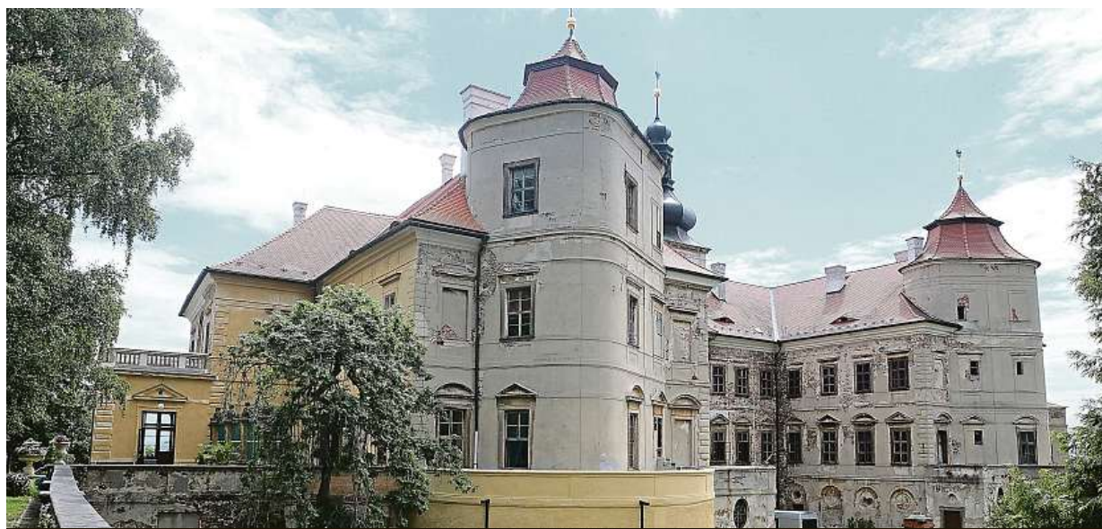
Na seznam národních kulturních památek se dostal také zámek Jezeří na Mostecku.

Ovocné stromy. V Česku mizí ročně stovky hektarů sadů. Ceny mléka. V Evropě se snižují, u nás jdou nahoru, vyplácí se prodávat ho do Německa. Vejsce. Obchody je někdy nabízejí za méně, než nakupují STRANA 7