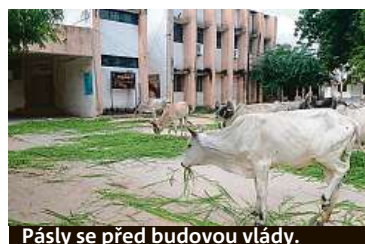
Pásly se před budovou vlády.

Letos v Gudžarátu podle úředních údajů 170 tisíc krav onemocnělo nodulární dermatitidou, což je nebezpečná virová nákaza, která se vyznačuje vznikem boulí na kůži a různých částech těla. Více než 5800 zvířat uhynulo. ČTK