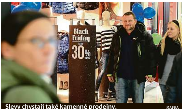
Slevy chystají také kamenné prodejny.

Přestože současná energetická krize nabádá spíše k šetření, výrazné slevy, které budou obchodníci od pátku do pondělí nabízet, k výhodným nákupům kdekoho zlákají. Podle odborníků by si však lidé měli dát pozor na nekalé praktiky podvodníků. „Nejčastěji pozorujeme snahu podvodníků okrást lidi