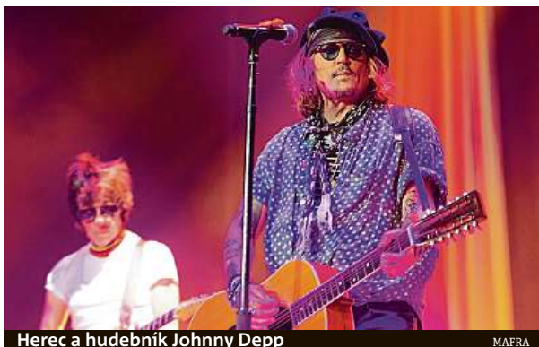
Herec a hudebník Johnny Depp