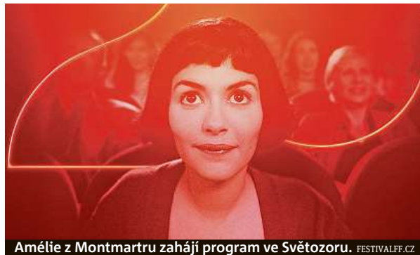
Amélie z Montmartru zahájí program ve Světozoru. FESTIVALFF.CZ

Festival bude dnes slavnostně zahájen v kině Lucerna předpremiérou animovaného snímku Mikulášovy patálie: Jak to celé začalo, který získal hlavní cenu na letošním festivalu animovaného filmu v Ancey. Kultovní film Amélie z Montmartru zahájí festival v podvečer v kině Světozor, večerní projekce zde bude patřit snímku režisérky Maryam