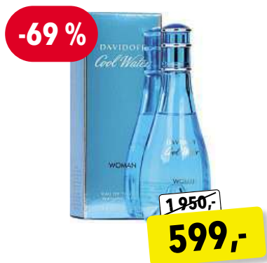
Davidoff Cool Water Woman EdT 100 ml

Cena v Douglas 1 950,- Cena v Sephora 1 790,-