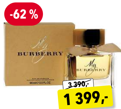
Burberry My Burberry EdP 90 ml

Cena v Douglas 2 350,- Cena v Sephora 2 350,-