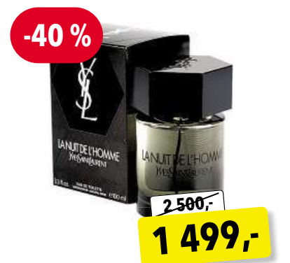
YSL La Nuit de L'Homme EdT 100 ml

Cena v Douglas 2 599,- Cena v Sephora 2 550,-