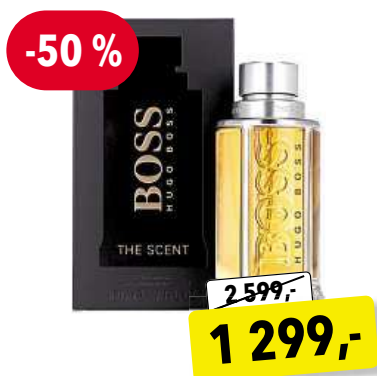
Hugo Boss The Scent EdT 100 ml

Cena v Douglas 1 790,- Cena v Sephora 1 690,-