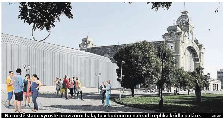
Na místě stanu vyroste provizorní hala, tu v budoucnu nahradí replika křídla paláce. MHMP

Z Výstaviště by mohla v budoucnu zmizet matejská pouť. Podle primátorky její současná podoba není moder-