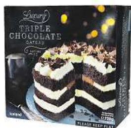
Trojité čokoládové dort