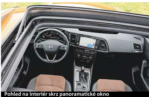
Pohled na interiér skrz panoramatické okno

V Česku se ateca prodává za nejnižší cenu 524 tisíc korun – dostanete za to litrové TSI s 85 kilowatty. A třebaže je Ateca jméno městečka ve španělské provincii Zaragoza, vyrábí se v českých Kvasinách. Technika vychází z platformy MQB s příčně uloženými motory, design rozvíjí zejména tvarem světél povedené modely Leon či Ibiza.