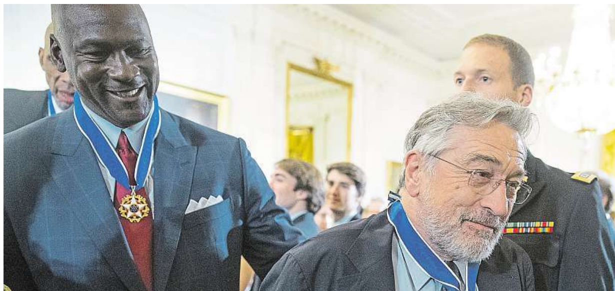
Prezident Obama uděloval vyznamenání. Dostalo se i na basketbalistu Jordana či herce De Nira. Více na straně 12

Osm kousků. Tolik půllitrů piva týdně vypije průměrný muž, ženy zhruba dva. Je to levnější. Nový průzkum ukázal, že více Čechů si dá pivo doma. Trend. Mladé dívky pijí častěji. Anketa. Jak si pivo vybíráme? STRANY 8 A 10