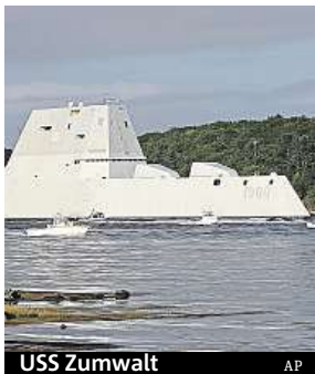
USS Zumwalt

Nejdražší torpédoborec na světě postihly nečekané problémy.