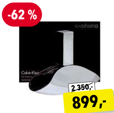
Calvin Klein Euphoria EdP 100 ml

Cena v Douglas 1 950,- Cena v Sephora 1 790,-