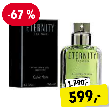
Calvin Klein Eternity for Men EdT 100 ml

Cena v Douglas 3 390,- Cena v Sephora 3 390,-