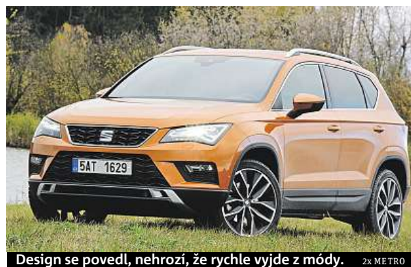
Design se povedl, nehrozí, že rychle vyjde z módy. 2x METRO

na zadní nápravu jde vždy 3 až 5 % točivého momentu. Výrazné zadek zapojí, až když to vyhodnotí podle spousty proměnných, třeba podle úhlu natočení volantu, sešlápnutí plynu nebo kvality povrchu. Díky sportovním kolům je naopak ateca pevná