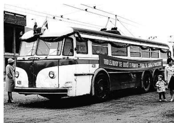
Poslední trolejbus v Praze vyjel v říjnu roku 1972. ADPP