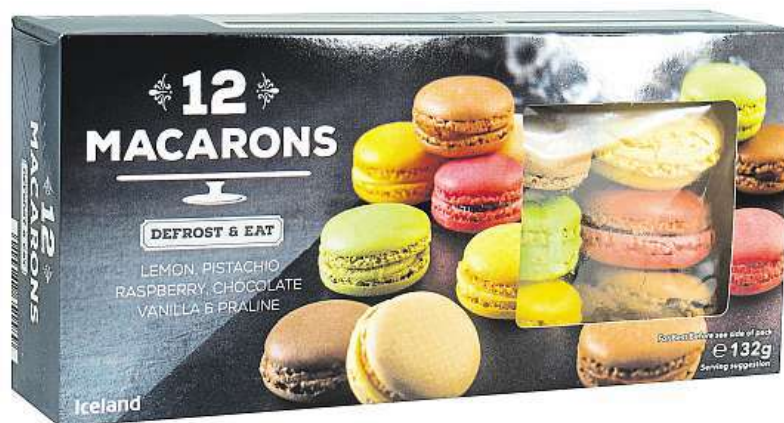
Tucet makaronek s různými příchutěmi

Mraženými produkty u nás v Islandu doslova žijeme! Proč? Příprava zamraženého jídla je úžasně snadná. Mrazení je přirozený způsob, jak prodloužit životnost pokrmů a čerstvých potravin. Živiny a vitamíny jsou zachovány i bez přidání konzervantů a umělých látek. Potravin jsou zamrazeny ve stavu ideální čerstvosti, tedy téměř okamžitě po sklizni, výlovu, upečení apod. Používáme technologii šokového zmrazení (zmrazeno na velmi nízkou teplotu