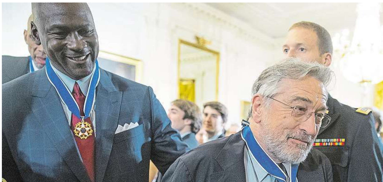
Prezident Obama uděloval vyznamenání. Dostalo se i na basketbalistu Jordana či herce De Nira. Více na straně 6

Osm kousků. Tolik půllitrů piva týdně vypije průměrný muž, ženy zhruba dva. Je to levnější. Nový průzkum ukázal, že více Čechů si dá pivo doma. Trend. Mladé dívky pijí častěji. Anketa. Jak si pivo vybíráme? STRANY 2 A 3