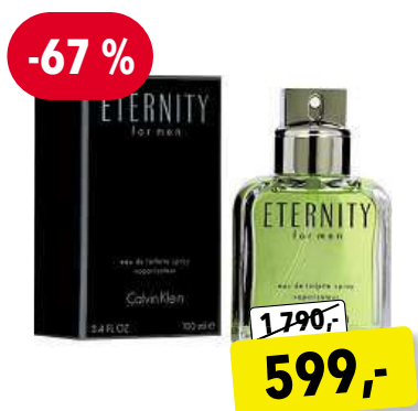
Calvin Klein Eternity for Men EdT 100 ml

Cena v Douglas 3 390,- Cena v Sephora 3 390,-