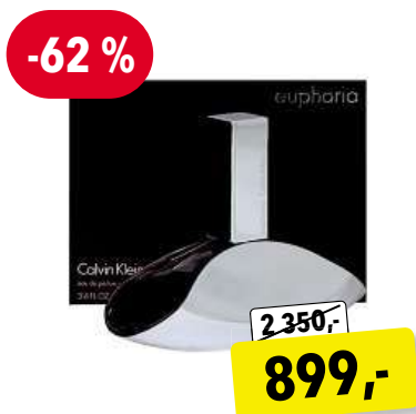
Calvin Klein Euphoria EdP 100 ml

Cena v Douglas 1 950,- Cena v Sephora 1 790,-