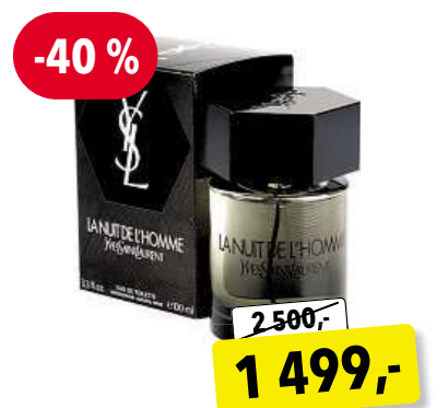
YSL La Nuit de L'Homme EdT 100 ml

Cena v Douglas 2 599,- Cena v Sephora 2 550,-