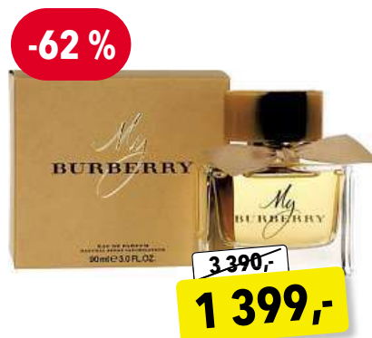
Burberry My Burberry EdP 90 ml

Cena v Douglas 2 350,- Cena v Sephora 2 350,-