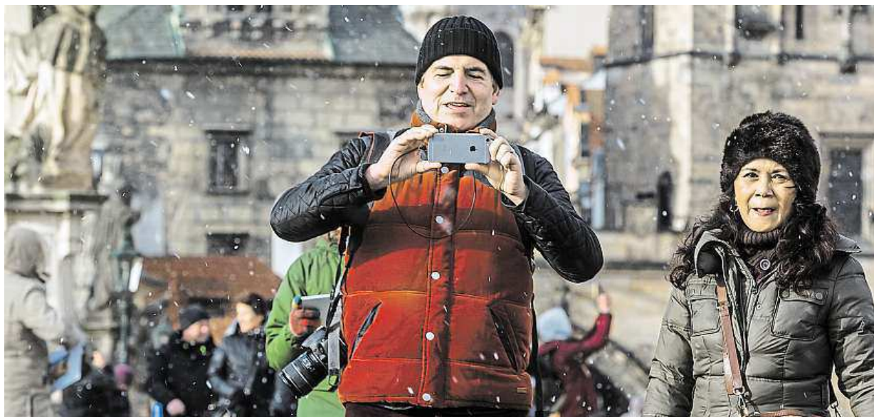
První sníh v Česku včera překvapil i turisty na pražském Karlově mostě. Na horách by se ale mohl udržet.

Obavy. Minulý týden si Češi koupili o 20 procent méně letenek než ve stejném období loni. Vánoce. Letos advent strávíme spíš doma. Dovolené. Místo do Egypta vyrazíme na zájezdy do Řecka nebo Bulharska STRANA 2