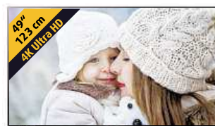
LG ULTRA HDTV 4K

Tím však všechna překvapení nekončí. Co vše se v televizi LG 49UF695V za cenu 19 990 Kč skrývá, lze zjistit v prodejních DATART nebo na www.datart.cz .