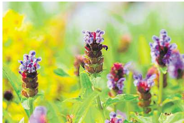
Také tymián je jednou z účinných bylinek.

Kašel provází většímu respiračních onemocnění. Ten akutní je z 90 procent vyvolán virovými infekcemi, které stojí za záněty průdušek hlavně u dětí.