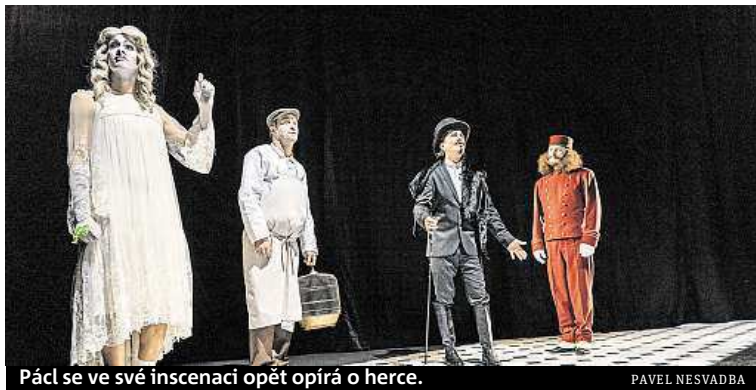
Pácl se ve své inscenaci opět opírá o herce.