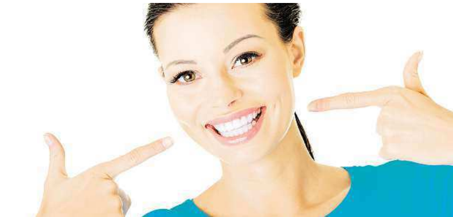
Bělení zubů by se mělo provádět ve stomatologické ordinaci.