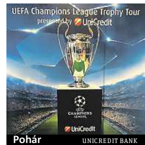
Pohár UNICREDIT BANK

dit je již sedmým rokem hrou oficiální bankou UEFA Champions League. MET