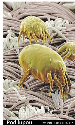
Pod lupou 2x PROFIMEDIA.CZ

lech. Spojují se s většími částicemi prachu a rychleji se usazují na povrchy v domácnosti. Do lidského organismu se dostávají vdechnutím. Problémy roztočového původu často vznikají po ulehnutí do postele, při hraní dětí na postelích, pohovkách a kobercích, při luxování a úklidu. Alergie na roztoče přitom může způsobit vážné zdravotní potíže: chronický zánět dý-