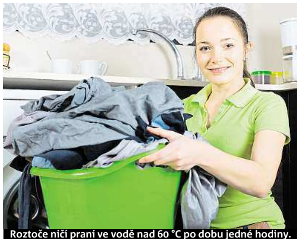
Roztoče ničí praní ve vodě nad 60 °C po dobu jedné hodiny.

Roztoči způsobují nemoci svými alergeny, které jsou nejvíce obsaženy v jejich výka-