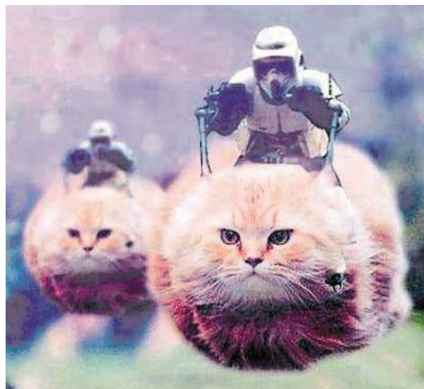
Místo fotek akce dávali lidé na Twitter své kočky.