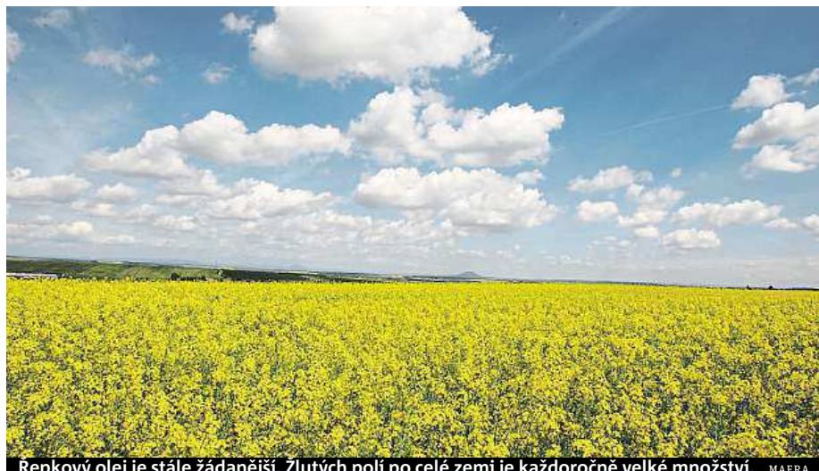
Řepkový olej je stále žádanější. Zlutých polí po celé zemi je každoročně velké množství.

Na druhou stranu jsou nedílnou součástí fyziologických procesů organismu, jako je třeba syntéza hormonů.