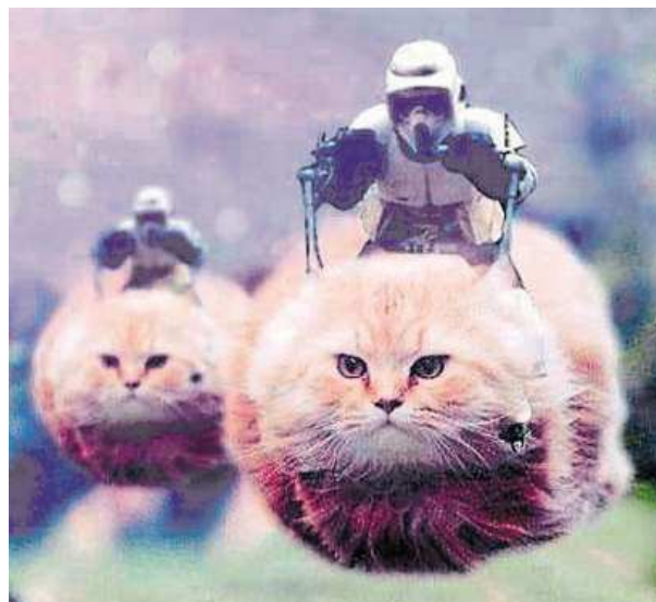
Místo fotek akce dávali lidé na Twitter své kočky.