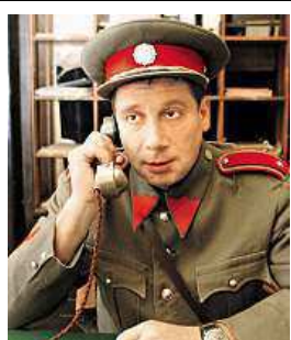
Jak šel čas

A to je jediné dobře, protože podle kurátora Muzea Policie ČR Františka Soukupa jsou současné uniformy vzor 92 co do materiálu a ušití ještě horší, než co bezpečnostní složky nosily ještě předtím. Na co policisté tedy v minulosti nejvíce nadávali? „Četníci a policisté za první republiky neměli v oblibě služební