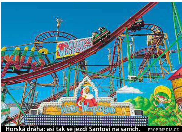
Horská dráha: asi tak se jezdí Santovi na saních.

Češi ještě stále nemají objevenou dánskou Kodaň, která je domovem těch nejlepších architektů. Velkým kodaňským lákadlem ve spojení s Vánoci jsou atrakce ve světoznámém zábavním parku Tivoli. Je nejstarší v Evropě. Na jednom místě si můžete vychutnat vánoční atmosféru i adrenalinový zážitek. Najdete tu nespočet gigantických kolotočů (jeden z nich Himmelskibet měří 80 metrů a je