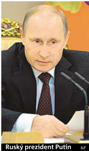
Ruský prezident Putin

Ruský prezident Vladimir Putin neholdá být doživotním prezidentem. Prohlásil to v rozsáhlém rozhovoru pro státní agenturu TASS. Svou kandidaturu však zváží s ohledem na aktuální situaci a na své preference.