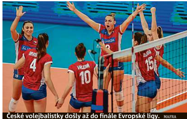
České volejbalistky došly až do finále Evropské ligy.

Tolik sportů, které patří mezi olympijské, dostalo podporu pro přípravu a rozvoj žen s výhledem pro olympijské hry v Los Angeles v roce 2028. Šlo o fotbal, basketbal, volejbal, házenou, pozemní hokej, vodní pólo a ragby. Celkem rozdala Národní sportovní agentura 150 milionů korun. PUR