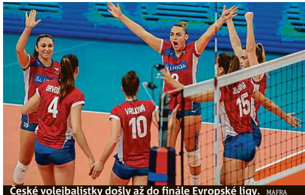
České volejbalistky došly až do finále Evropské ligy.

Tolik sportů, které patří mezi olympijské, dostalo podporu pro přípravu a rozvoj žen s výhledem pro olympijské hry v Los Angeles v roce 2028. Šlo o fotbal, basketbal, volejbal, házenou, pozemní hokej, vodní pólo a ragby. Celkem rozdala Národní sportovní agentura 150 milionů korun. PUR