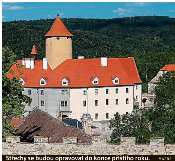
Střechy se budou opravovat do konce příštího roku.

Oprava části střech za 14 milionů korun začne v listopadu na hradě Veveří. Jde o poslední část střech na hradě, všechny ostatní už jsou opravené.