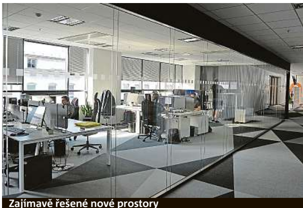
Zajímavě řešené nové prostory

Dosud firma sídlila v administrativním komplexu Spielberk Office Centre v Holandské ulici. Už se však pro ni stal zastaralým, přestože byl dobudovaný teprve v minulém desetiletí. „Snažíme se držet uniformní standard ve všech našich sídlech. Nastavili jsme ho v Praze a máme ho