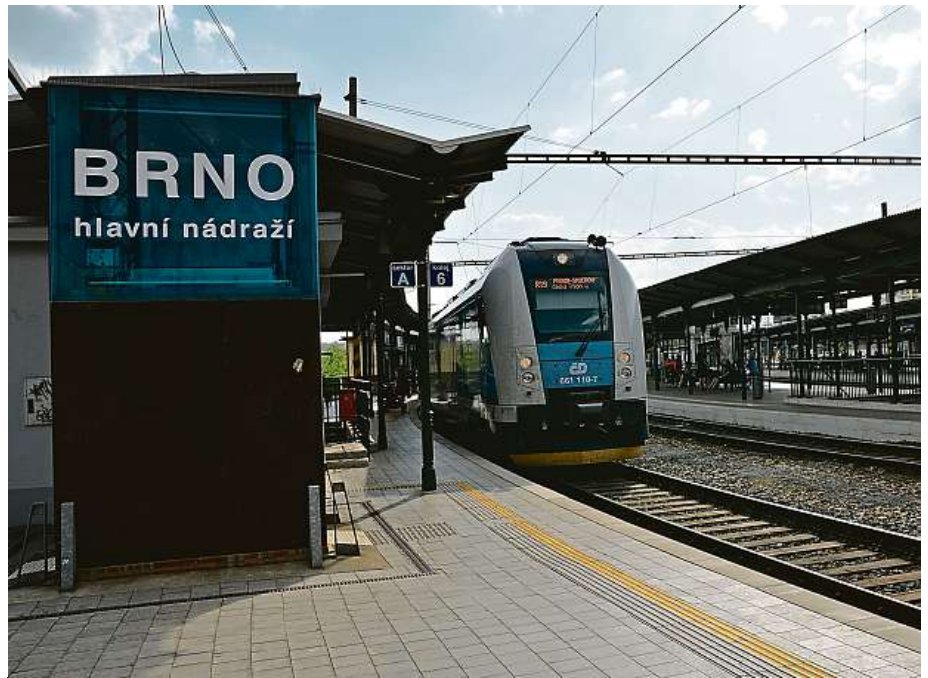
Přijede tento vlak příště do stanice Praha-venkov?