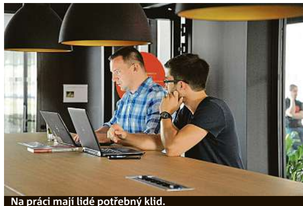
Na práci mají lidé potřebný klid.

Avast vznikl jako česká technologická firma ještě za socialismu, v roce 1988, letos oslavil 30 let. Před dvěma lety koupil společnost AVG, značku však zachoval.