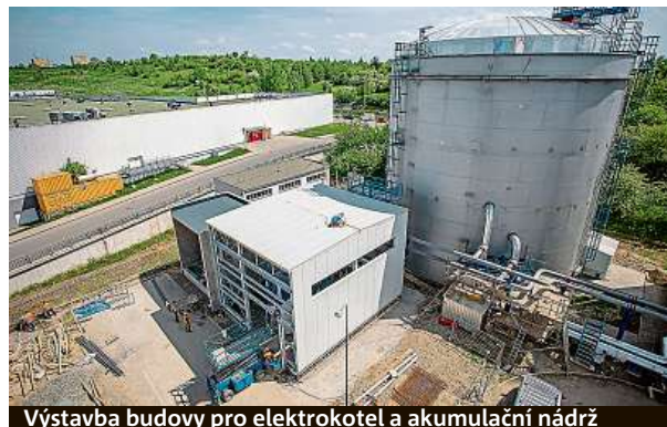
Výstavba budovy pro elektrokotel a akumulční nádrž