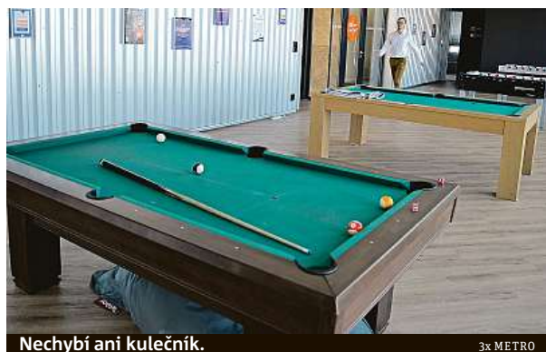
Nechybí ani kulečník.