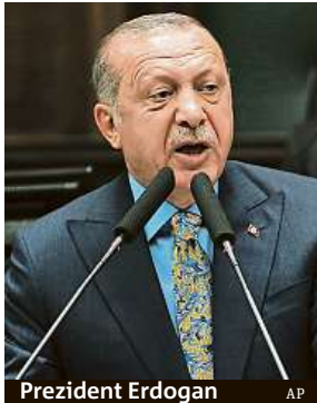
Prezident Erdogan

Turecký prezident položil v parlamentu otázku, kde je tělo usmrčeného novináře. Na to zatím Saúdové neodpověděli.