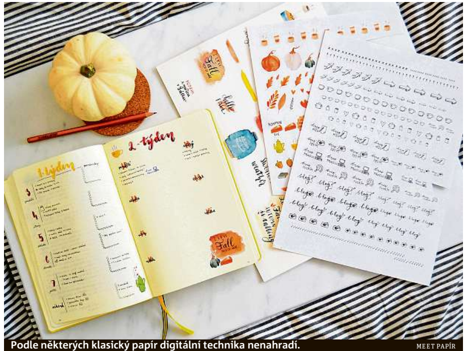
Podle některých klasický papír digitální technika nenahradí.

Návštěvníci se také mohou zúčastnit workshopů, například se naučí, jak si psát deník, nebo si vyrobí dekorace z papíru. Mohou si také ušít diář či si třeba vyzkoušet moderní kaligrafii. A k tomu organizátoři slibují skvělou kávu a malé občerstvení. HO