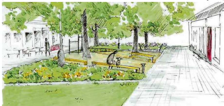
Pohled do parku z ulice Jihlavská

Čtyřka připravila revitalizaci jednoho z prostranství mezi domy v Jihlavské ulici poblíž Kačerova, kde se rádi scházejí místní obyvatelé. Potraviny U Beránků konkurují svou nabídkou i možnostmi po sousedsku si popovídat supermarketu Billa, v restauraci U Kubíka se dobře vaří, i čínské bistro má už své věrné hosty. Místo však hyzdí rozbitý asfalt a pod stromy skomírající travník.