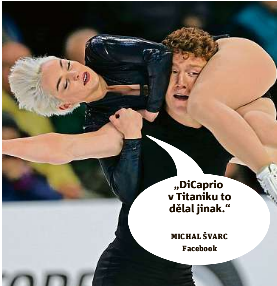
„DiCaprio v Titaniku to dělal jinak.“ MICHAL ŠVARC Facebook

Napište bublinu a reagujte na sloupek na: www.facebook.com/denikmetro