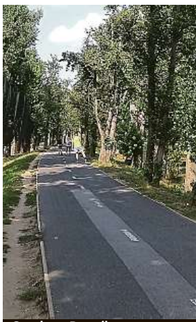
Stežka v Braníku ARCHIV

Stromořadí podél cyklostezky v Braníku absolvovalo ozdravnou kúru.