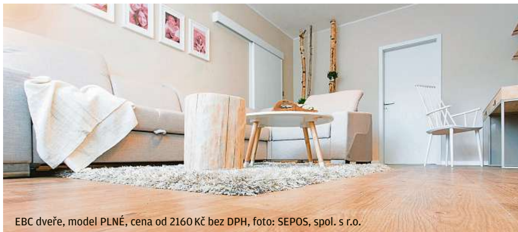
EBC dveře, model PLNÉ, cena od 2160 Kč bez DPH, foto: SEPOS, spol. s r.o.

EBC dveře jsou vhodné do bytových i kancelářských prostor. Na výběr je několik modelů dveří, na své si přijdou milovníci hladkých linií i ti, kteří mají rádi profilování. Samozřejmostí jsou plně i prosklené varianty s různou mírou prosklení, ať již v klasickém otočném provedení polodrážkovém, bezfalcovém nebo dveře posuvné. Další možností jsou vyšší dveře až do výšky 259 cm případně různá atypická provedení. Samozřejmostí jsou zárubně, na výběr jsou dvě varianty barevně odpovídající povrchové úpravě zárubní.