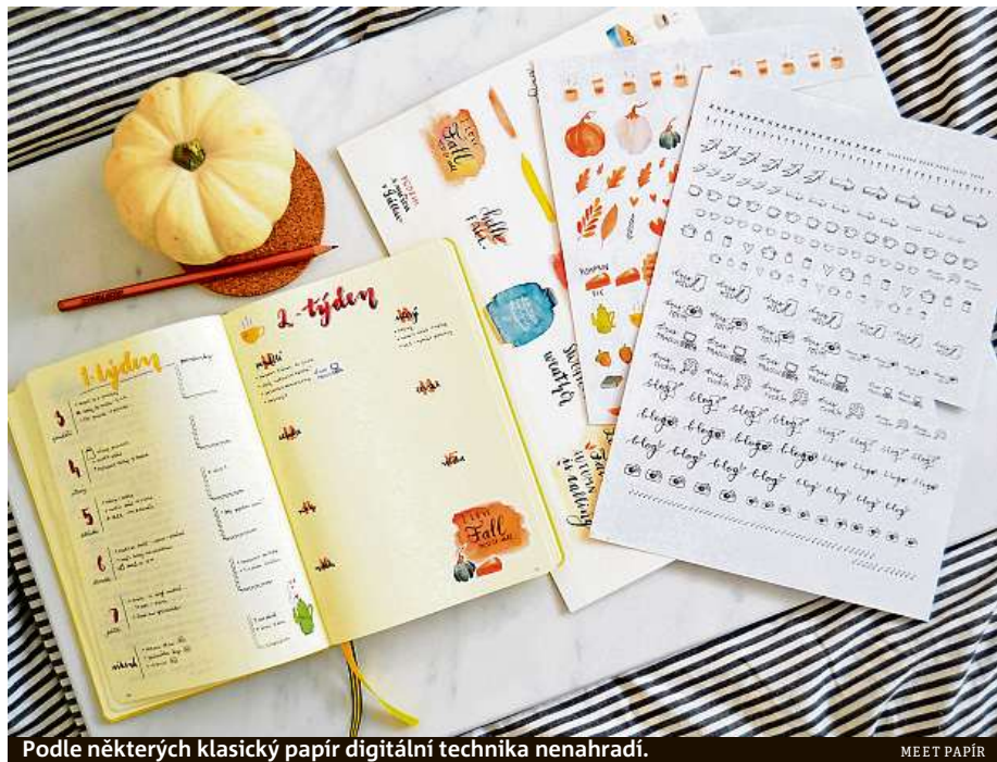
Podle některých klasický papír digitální technika nenahradí.

Návštěvníci se také mohou zúčastnit workshopů, například se naučí, jak si psát deník, nebo si vyrobí dekorace z papíru. Mohou si také ušít diář či si třeba vyzkoušet moderní kaligrafii. A k tomu organizátoři slibují skvělou kávu a malé občerstvení. HO