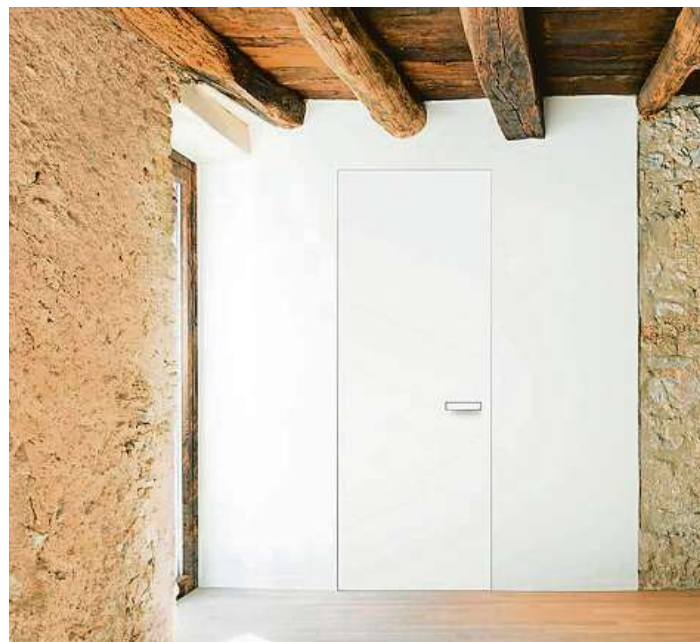
Dveře instalované ve skryté zárubni