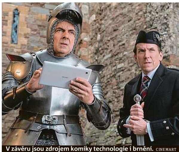
V závěru jsou zdrojem komiky technologie i brnění. CINE.MART

Třetí díl trilogie o komicím špiónovi ve službách brit-