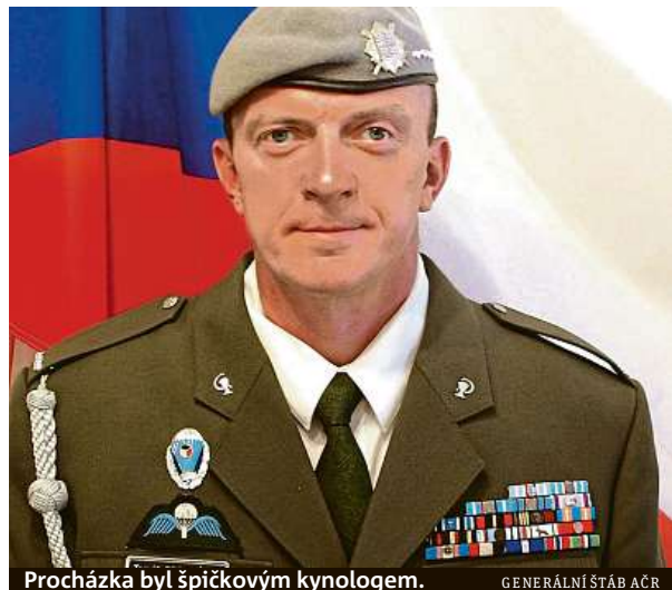
Procházka byl špičkovým kynologem.