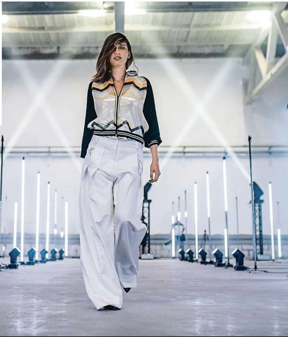
Na přehlídkovém mole návštěvníci uvidí 32 módních přehlídek.