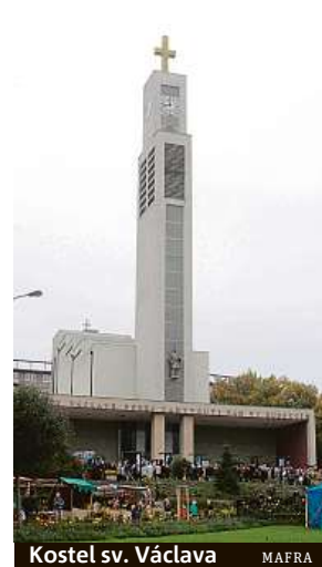
Kostel sv. Václava

Otevřeny budou například kostel sv. Václava ve Vršovcích, kostel Nejsvětějšího srdce Páně na Vinohradech, Ministerstvo průmyslu a obchodu ČR na Františku, Palác Metro nebo Tyršův dům. Zde bude od 14 hodin komentovaná prohlídka pro děti. Od 10 do 18 hodin bude možné prohlédnout si v přístavišti lodí na Rašínově nábřeží i historický parník Vyšehrad. PUR