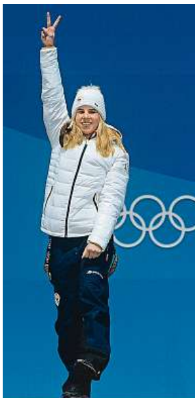
Olympijská oslava