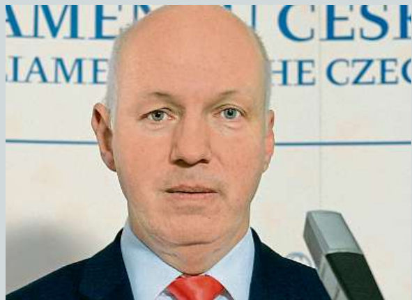
Nový senátor Pavel Fischer se rozhodl.