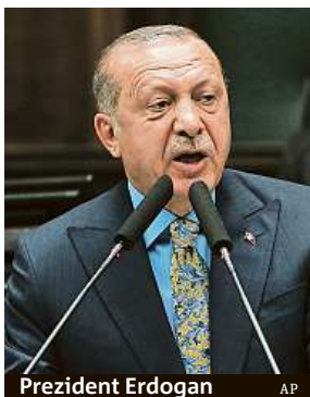
Prezident Erdogan

Turecký prezident položil v parlamentu otázku, kde je tělo usmrčeného novináře. Na to zatím Saúdové neodpověděli.