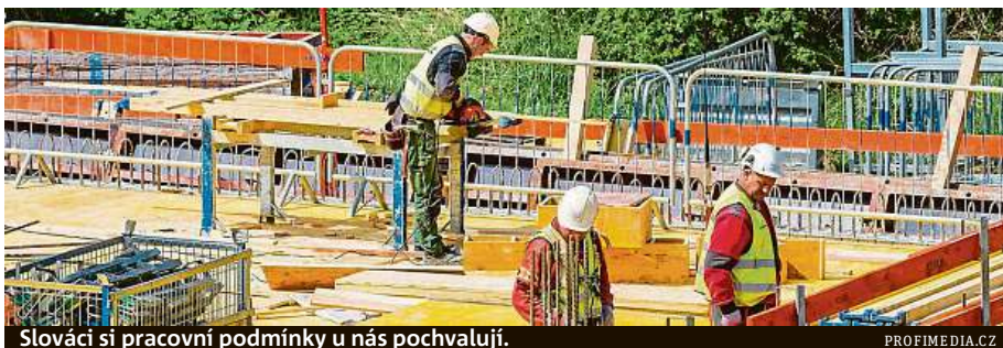
Slováci si pracovní podmínky u nás pochvalují.

„Ukázalo se, že řada Slováků do 35 let, kteří tu dnes žijí, jsou světoběžníci. Třetina z nich studovala či žila i jinde v zahraničí. S těmito zkušenostmi se ale bohužel