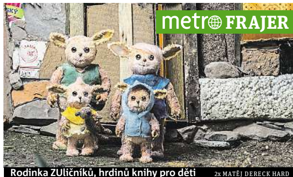
Rodinka ZULIČNÍKŮ, hrdinů knihy pro děti 2x MATĚJ DERECK HARD