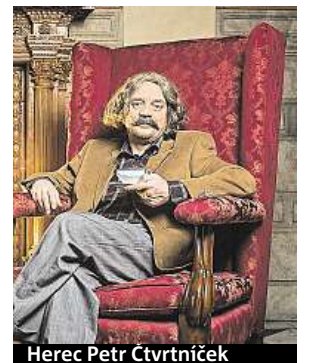
Herec Petr Čtvrtníček