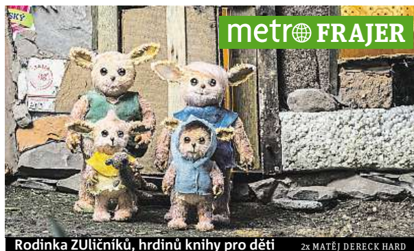
Rodinka ZULIČNÍKŮ, hrdinů knihy pro děti 2x MATĚJ DERECK HARD