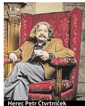
Herec Petr Čtvrtníček