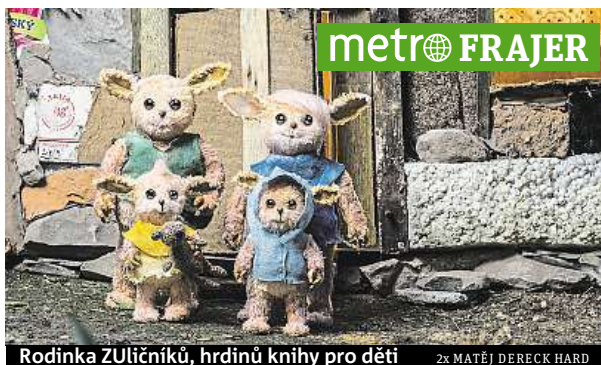
Rodinka ZULIČNÍKŮ, hrdinů knihy pro děti 2x MATĚJ DERECK HARD