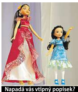
Napadá vás vtipný popisěk?

Napište bublinu a reagujte na sloupek na: www.facebook.com/denikmetro