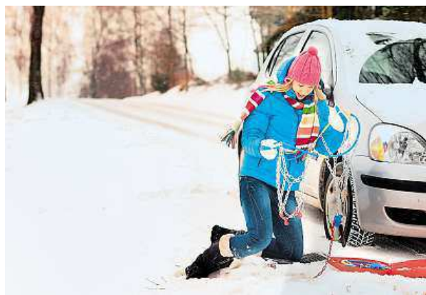
Při cestě do hor vozte sněhové řetězy s sebou.

Ačkoliv sněhové řetězy u nás nepatří do povinné výbavy, neměly by při cestě do