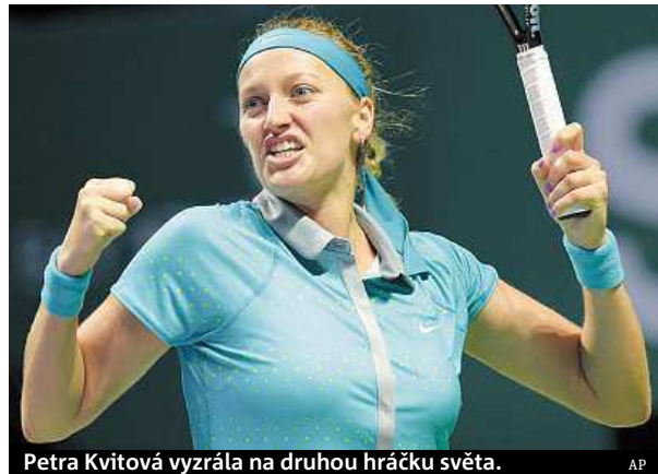
Petra Kvitová vyzrála na druhou hráčku světa.

První semifinalistkou turnaje je Rumunka Simona Halepová z druhé – červené skupiny.