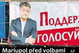
Mariupol před volbami

skončit populistická a současně proevropská Radikální strana, na třetím pak proevropská Lidová fronta, kterou zformoval letos v březnu premiér Arsenij Jaceňuk.