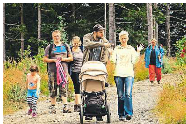
Na výlet vyrazte s celou rodinou.

Klub českých turistů pořádá pochod již podesáté. „Dodržujte pravidla silničního provozu, abyste vy i ostatní pohodlně došli,“ nabádají typickým turistickým slangem pořadatelé.