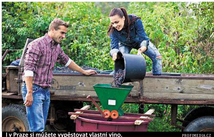
I v Praze si můžete vypěstovat vlastní víno.

„Přijít může každý. Jsme otevření všem. Prostoru je více než dost,“ informuje předsedkyně sdružení, které spravuje na Proseku více než 1,9 hektaru velký vinohrad. MAH