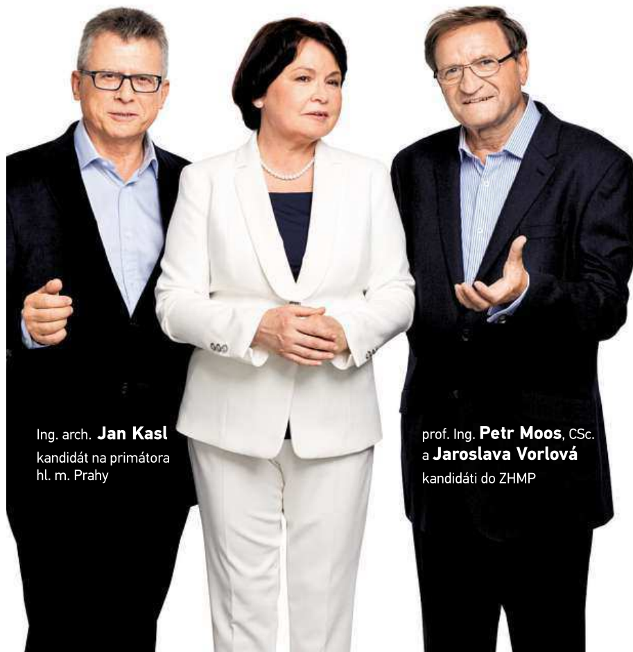
Ing. arch. Jan Kasl kandidát na primátora hl. m. Prahy