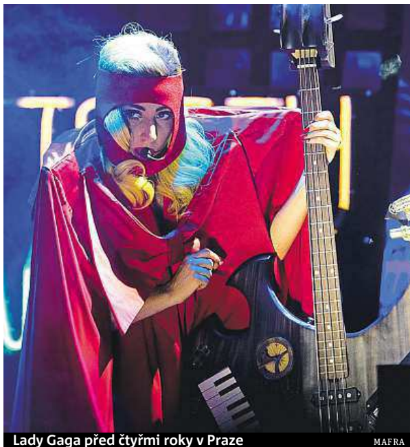
Lady Gaga před čtyřmi roky v Praze

V O 2 areně pak představí svá nová alba dvě velká jména světového popu: nejprve to bude 21. října Kylie Minogue a v listopadu zahraje novinky ze svého nového alba Strut Lenny Kravitz. METRO