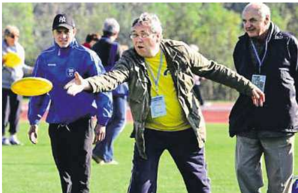
Sport se týká i seniorů. Mohou využít akcí radnice.

„Městská část Praha 9 se může chlubit cyklostezkou, která je nejdelší v Praze. Vedle jízdy na kole je možné stezku využívat také k jízdě na bruslích i k běhu. Zároveň lze také běhat podél říčky Rokytka, kde není takový pro-