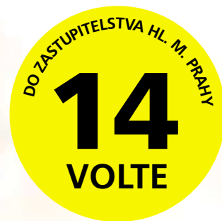
Petra Venturová PŘEDSEDKYNĚ POLITICKÉHO HNUTÍ PRO PRAHU