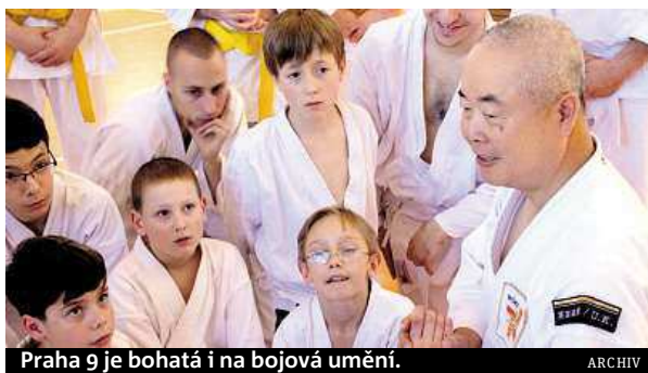
Praha 9 je bohatá i na bojová umění.