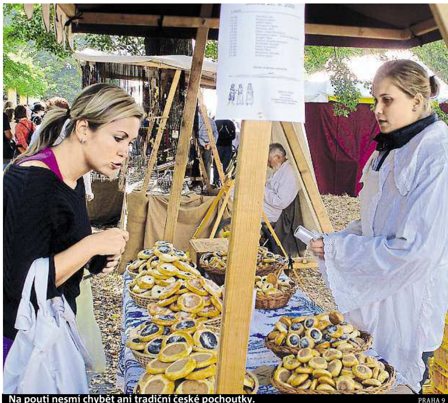
Na pouti nesmí chybět ani tradiční české pochoutky.

Stejně jako každý rok i letos se mohou návštěvníci těšit na bohatý kulturní program, a to nejen na hlavním pódiu. „Rok od roku se snažíme program obohatit a přinést lidem opravdu zajímavé interprety, aby tato podzimní oslava byla skutečným kulturním zážitkem,“ komentuje