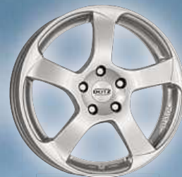
DOTZ Freeride si