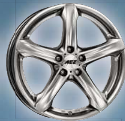
AEZ Yacht / Yacht SUV