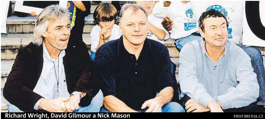
Richard Wright, David Gilmour a Nick Mason

Jedná se o první album Pink Floyd od roku 1994, kdy vydali The Division Bell. Celý projekt začal tím, že kytarista Gilmour a Mason se probírali hudbou, kterou nahráli s Wrightem při přípravě The