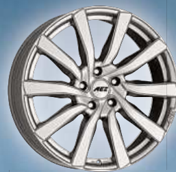
AEZ Reef si / Reef SUV si