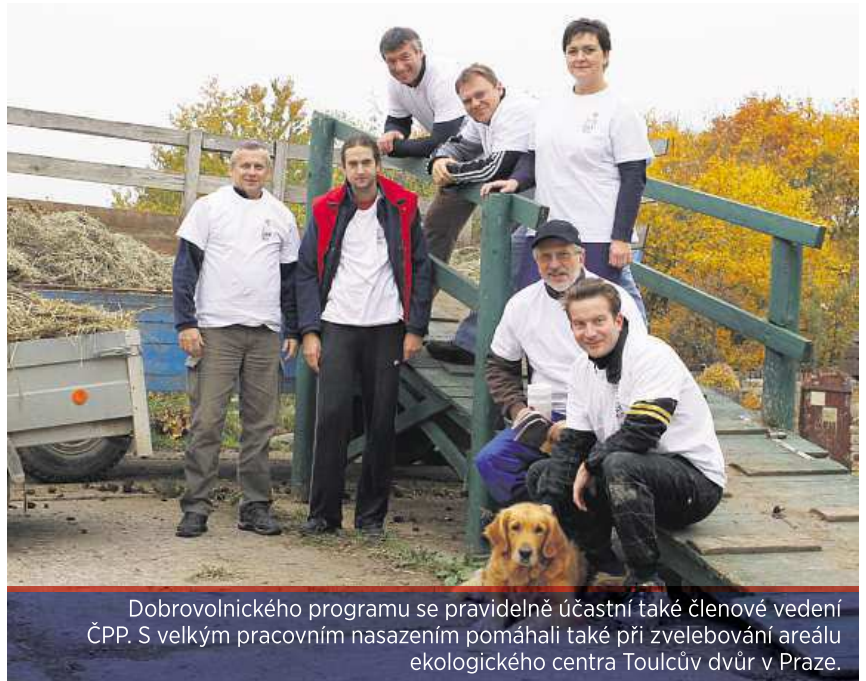
Dobrovolnického programu se pravidelně účastní také členové vedení ČPP. S velkým pracovním nasazením pomáhali také při zvelebování areálu ekologického centra Toulcův dvůr v Praze.