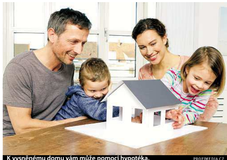
K vysněnému domu vám může pomoci hypotéka.

I tak ale na reklamních kampaních jednotlivých bank stále vidíme, jak nové klienty lákají především na nízkou úrokovou sazbu. „V poslední době jsme zažili prakticky nepřetržitě akční nabídky, které se z hlediska sazeb postupně promítají do základního sazebníku,“ říká vedoucí analytik společnosti Fincentrum Josef Rajdl. Podle něj se ale banky snaží získat zákazníky také slevami na všech souvisejících poplatcích včetně například zpracování znaleckého posudku. ROMANA BARBOŘÍKOVÁ