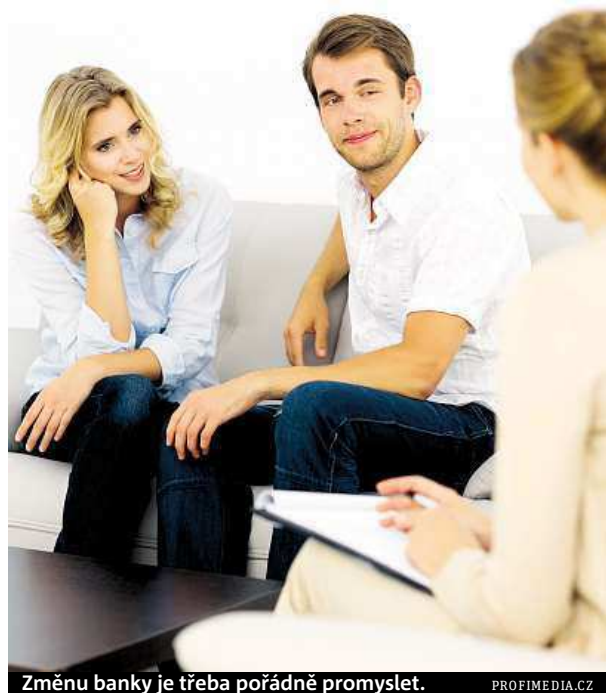
Změnu banky je třeba pořádně promyslet.