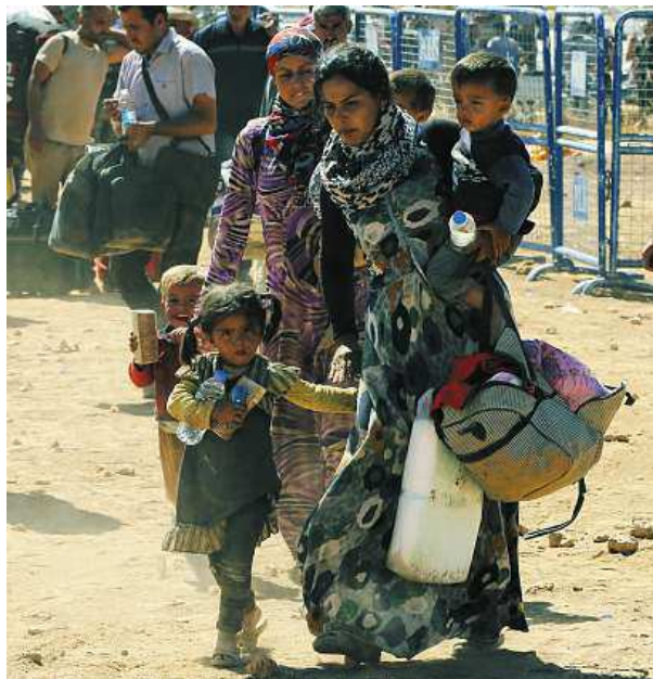
Lidé ze syrského příhraničí prchají především do Turecka.