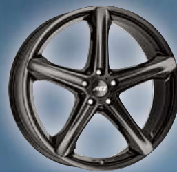
AEZ Yacht dark / Yacht dark SUV