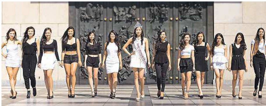
Která bude po loňské miss (na snímku uprostřed) další nejkrásnější Vietnamkou? ALEX TRAN

hů Čechů s Vietnamci tak málo? Podle Wintera by se daly spočítat na prstech jedné ruky. Vysvětlení je prosté: „Pro Vietnamky jsou vietnamští chlápci mnohem galantnější. České dívky jsou zase emancipované a chtějí rozhodovat. Vietnamci srovnávají s tím, co vidí doma.“