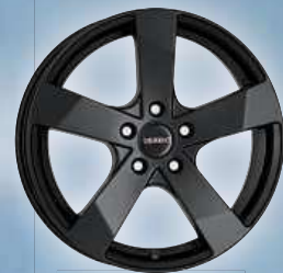
DEZENT TD dark