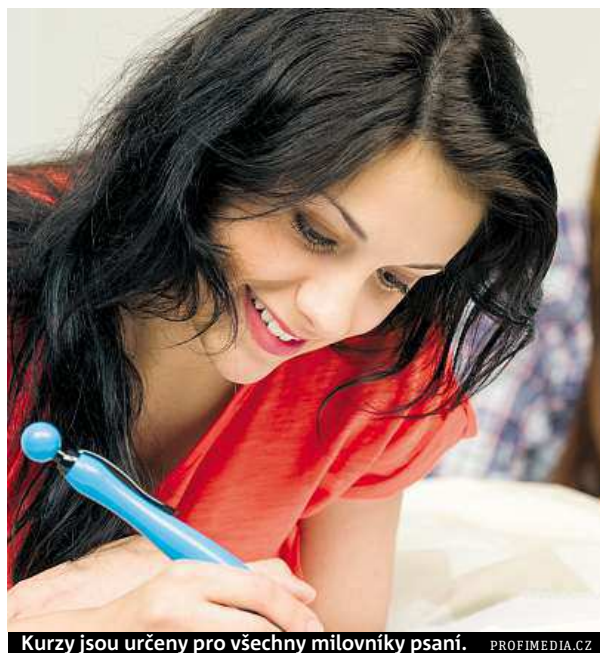
Kurzy jsou určeny pro všechny milovníky psaní.

Náplň kurzů bývá různorodá. „Ve svých kurzech se snažím účastníkům vytvořit ja-