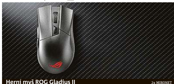
Herní myš ROG Gladius II

gonomický design pro ovládnutí pravou rukou, který vám zajistí komfort při dlouhých herních maratonech a technologii osvětlení Aura Sync, která překoná konkurenci. A konektivita? Gladius II nabízí dva typy bezdrátových konektorů, které splňují různé potřeby. Můžete jej okamžitě připojit pomocí dodávaného 1ms 2,4 GHz USB konektoru, nebo ho připojíte bezdrátově pomocí technologie bluetooth s nízkou spotřebou energie. Jeho snímač sleduje