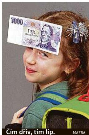
Čím dřív, tím líp.