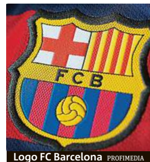
Logo FC Barcelona