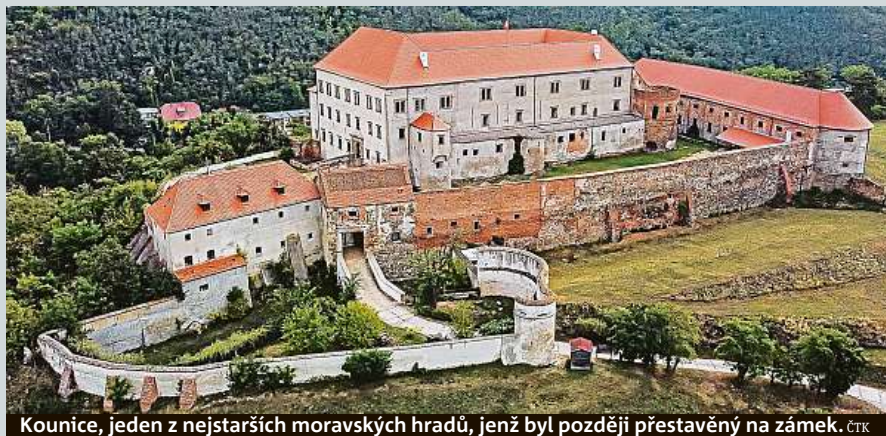
Kounice, jeden z nejstarších moravských hradů, jenž byl později přestavěn na zámek.