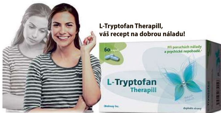
L-Tryptofan Therapill, váš recept na dobrou náladu!

Vyzkoušejte tradici ověřený, originální přípravek L-Tryptofan Therapill . Tento doplněk stravy obsahuje čistý a kvalitní L-tryptofan, jenž je přirozeným zdrojem hormonu štěstí (serotoninu), a vitamin B6, který přispívá ke snížení míry únavy a vyčerpání. L-Tryptofan Therapill vám proto pomůže navrátit duševní klid a ztracenou pohodu. Při jeho užívání se zároveň nebudete muset obávat nežádoucích účinků, jako je omezení bdělosti či návykovost.