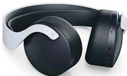
Sluchátka PS5 Pulse 3D Wireless Headset

Ať už je však hráč šťastným majitelem PlayStation 5, nebo tráví svůj čas na předchozí generaci, neobejde se žádný pořádný herní zážitek