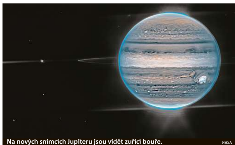
Na nových snímcích Jupiteru jsou vidět zuřící bouře.

Teleskop vynesla do vesmíru loni koncem prosince raketa Ariane 5 z kosmodromu Kourou ve francouzské Gyaně. Jde o dosud nejvýkonnější vesmírný dalekohled, vesmír od ledna letošního roku pozoruje ze vzdálenosti 1,5 milionu kilometrů od Země. čtk