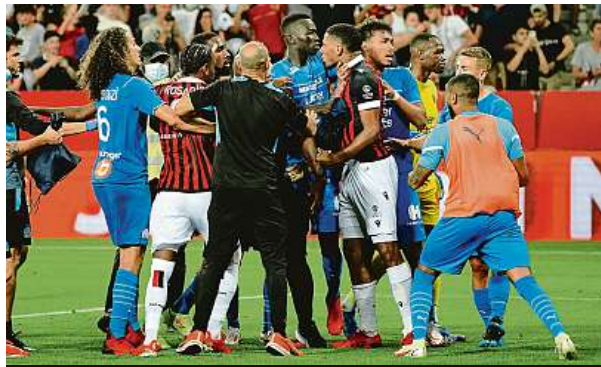
Rvačka ukončila duel Ligue 1 mezi Nice a Marseille.