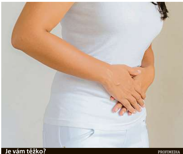
Je vám těžko?

U zdravého jedince se tvoří až dva litry střevního plynu denně. Když se ale plynů vytvoří více a ty se přestanou vstřebávat, pak mluvíme o plynatosti. Za nadměrnou plynatostí neboli meteorismem stojí zpravidla potraviny, které obsahují zkvasitelné sacharidy. Do této skupiny patří například fazole, čočka, cibule, banány, ale i jablka. Příčinou však může být také alergie na některý druh potravin, intolerance laktózy či lepkou, narušená střevní mikroflóra nebo stres, ale i například kouření či zvykání žvýkaček, které vedou k polykání vzduchu. Pokud nadýmání nevyvolávají tyto příčiny, je lepší obrátit se na lékaře.