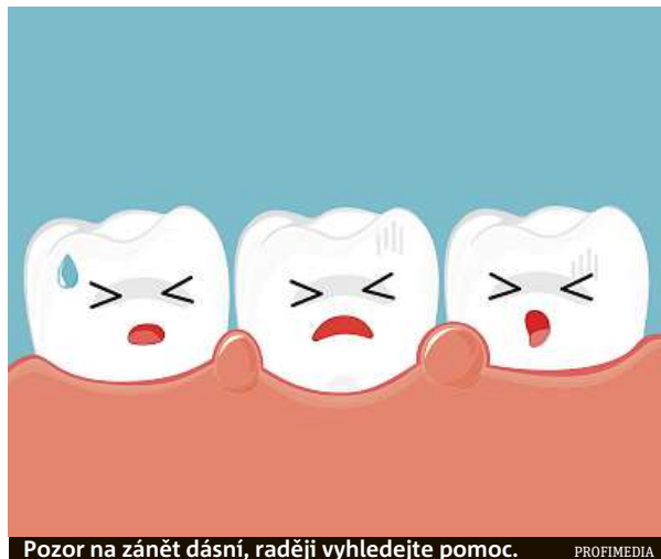
Pozor na zánět dásní, raději vyhledejte pomoc.

„Je považován za předstupeň paradontitidy, která postihuje hlubší tkáň a může