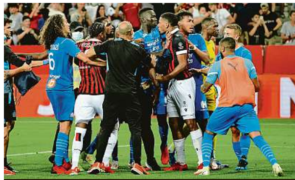
Rvačka ukončila duel Ligue 1 mezi Nice a Marseille.