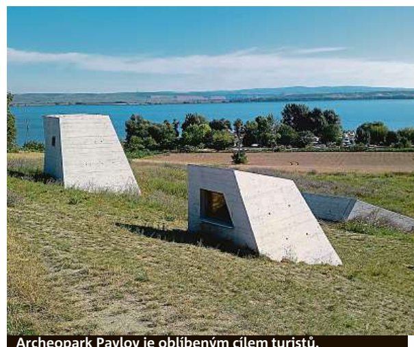
Archeopark Pavlov je oblíbeným cílem turistů.