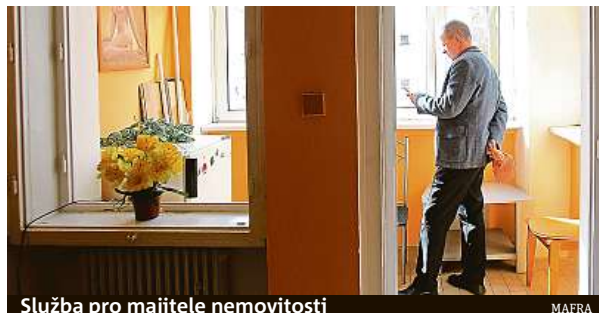
Služba pro majitele nemovitosti

Podle odhadů nabízí dlouhodobé nájemní bydlení přibližně 200 tisíc bytů, pro služby garantovaného nájmu je však vhodná jen necelá čtvrtina z nich. „Aby bylo možné