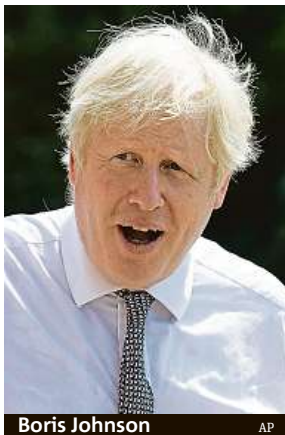
Boris Johnson

Britský předseda vlády Boris Johnson čelí kritice skotského farmáře, na jehož pozemku si o dovolené bez povolení postavil stan a zapálil oheň.