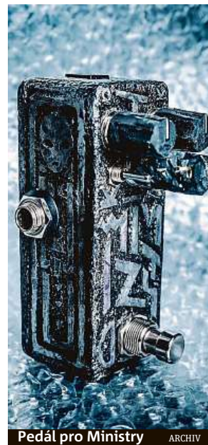
Pedál pro Ministry

Pro KHDK dělám jak designy pro sériovou výrobu, tak kousky na míru, které upravuju u sebe v garáži frézama a kyselinou. Mimo Kirka má garážovej pedál ode mě i Ro-