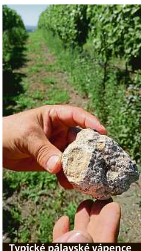
Typické pálavské vápence