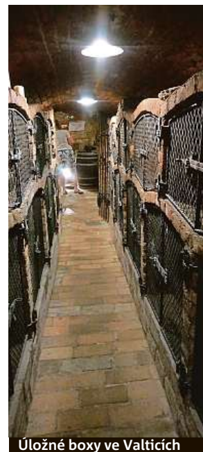
Úložné boxy ve Valticích