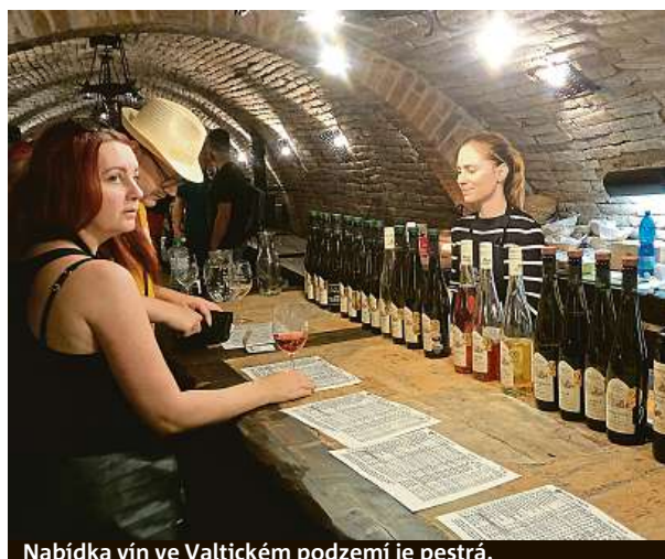
Nabídka vín ve Valtickém podzemí je pestrá.