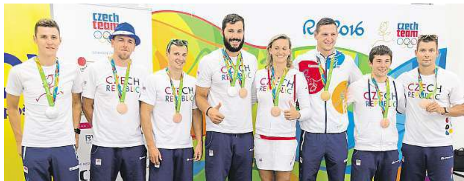
Do Prahy se vrátila další část českých medailistů z olympijských her v Riu.