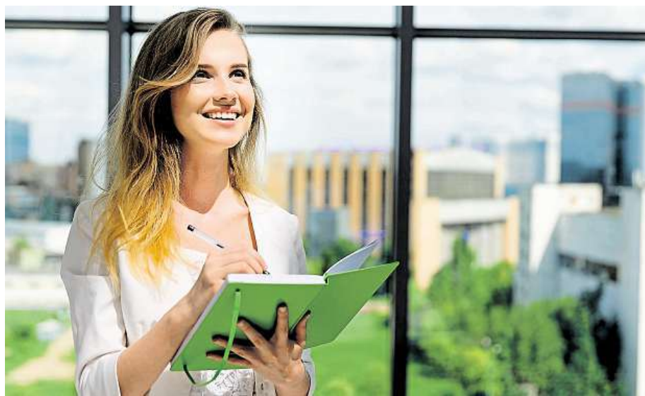
Do nové práce hlavně s úsměvem!

Je lepší vyvarovat se klišé, žadatel by neměl zapomenout, že personalista takových dopisů čte desítky. Motivační dopis se vyplatí napsat přehledně a stručně,