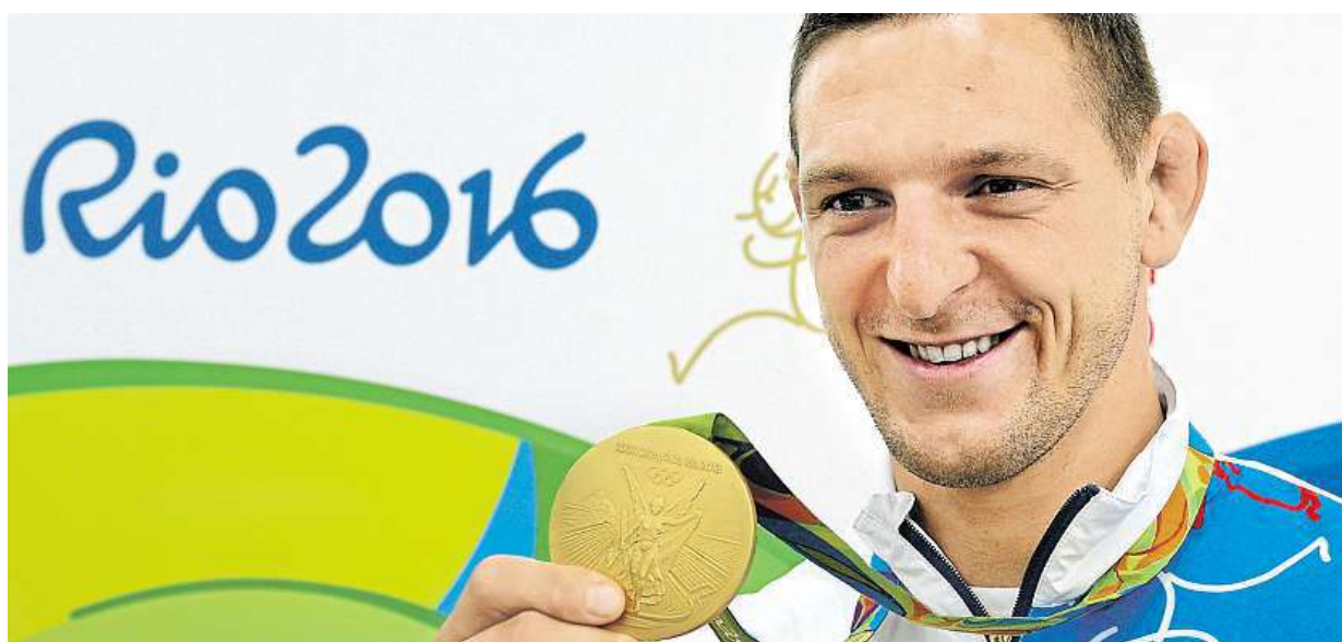
Krpálkovo brazilské zlato je v Česku. Olympionici se vrátili z her a ukázali medaile. Více na straně 11

Je to nesmysl. Dopravním expertům se nelíbí návrh zákona, který by umožnil až 0,8 promile alkoholu v krvi. Cyklista brzy vystřížliví. Pro jsou provozovatelé vinných stezek, kde je popíjení vína běžné STRANA 2