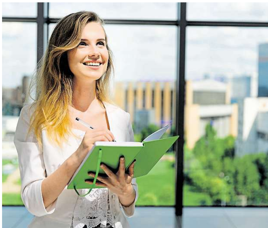
Do nové práce hlavně s úsměvem!

Je lepší vyvarovat se klišé, žadatel by neměl zapomínat, že personalista takových dopisů čte desítky. Motivační dopis se vyplátí napsat přehledně a stručně, maximálně však na jednu stránku. Kromě hrubek a překlepů je další častou chybou, když uchazeč napíše, že má zájem o pozici, splňuje všechny požadavky a shrne již přiložený ži-