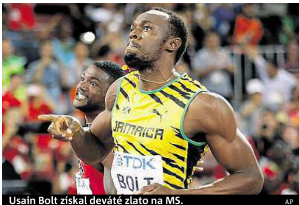
Usain Bolt získal deváté zlato na MS.

O pouhou setinu vyhrál Jamajčan na MS v Pekingu běh na 100 metrů před Justinem Gatlinem.