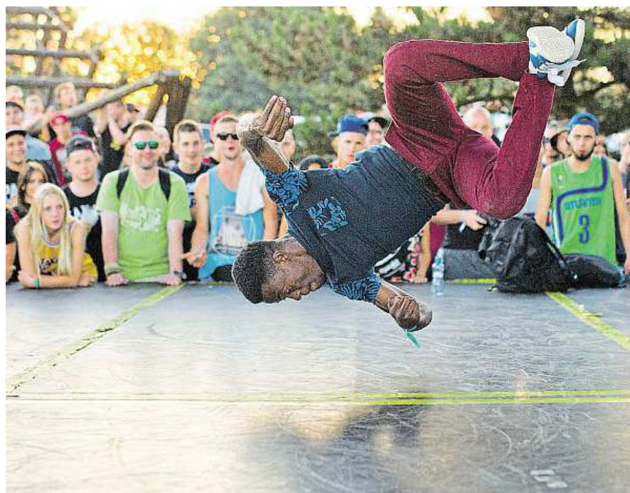
Na festivalu se uskutečnily soutěže v breakdance.