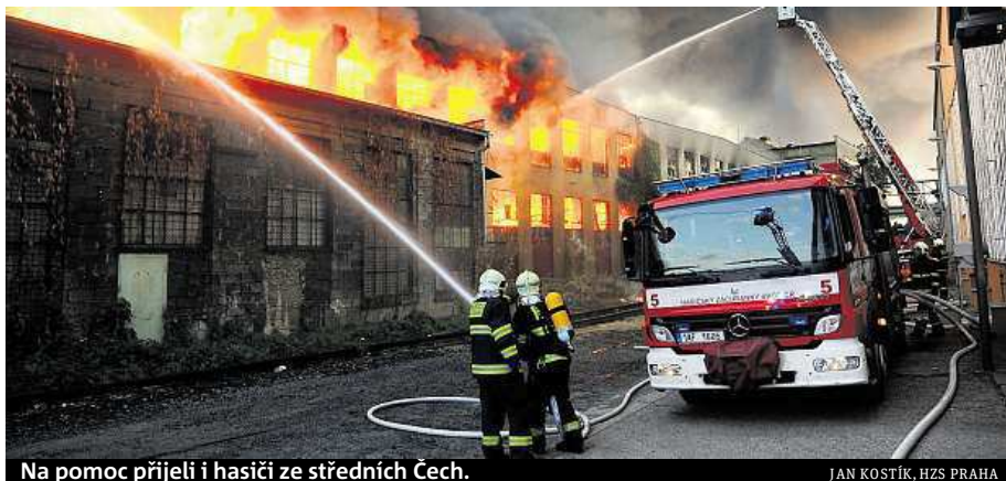
Na pomoc přijeli i hasiči ze středních Čech.

Vyšetřovatelé už začali pátrat po příčině vzniku největšího letošního požáru v metropoli, který zničil sklad textilu v tovární hale ve Vysočanech a nepochal škody za stamiliony korun. „Objekt již prohlédli statik, samotné dohledání místa a vyšetřování příčin proběhne v průběhu pondělního dopoledne. Do té doby bude areál strážěn policií,“ uvedla pražská policejní mluvčí Andrea Zoulová. Podle prvotních informací ve skladu shořelo zboží za více než 270 milionů korun, další škody jsou na budově a zařízení. Do vzduchu se podle měření nedostaly žádné nebezpečné látky, při požáru ni-