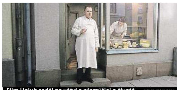
Film Holub seděl na větvi a přemýšlel o životě NEUE VISIONEN

Když jako malá zpívala v kostelním sboru, občas si vslechla, že její hlas je strašný. Dnes je zpěvačka Buika začínající hvězdou, která překračuje hudební žánry – je to fascinující mix maurských kořenů flamenka, kreolské morny i jazzu á la Billie Holidayová. Skladatelka a básnířka spolupracuje například s Chickem Coreou či Nelly Furtado, její hudbu si do svého filmu Kůže, kterou nosím vybral Pedro Almodóvar a poslední album jí vyneslo nominaci na Grammy. Vystoupí 5. října ve Státní opeře Praha na zahájení festivalu Struny podzimu. STRUNY PODZIMU