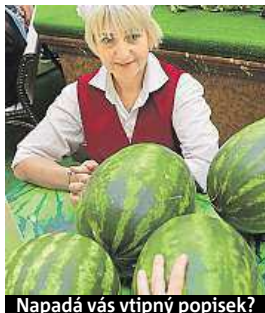
Napadá vás vtipný popisek?

Napište bublinu a reagujte na sloupek na: www.facebook.com/denikmetro