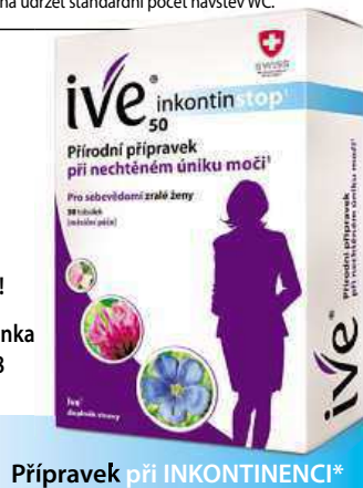
Přípravek při INKONTINENCI*

Žádejte v lékárnách! bezplatná linka 800 555 568