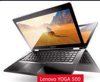
Lenovo YOGA 500

Asi největším rozdílem oproti konkurenci je potom design. Výrobce si dal skutečně záležet a Yoga 500 vypadá opravdu reprezentativně. Zvláště v nádherné červené barvě! Volit ale můžete i z konzervativnější černé nebo elegantní bílé.