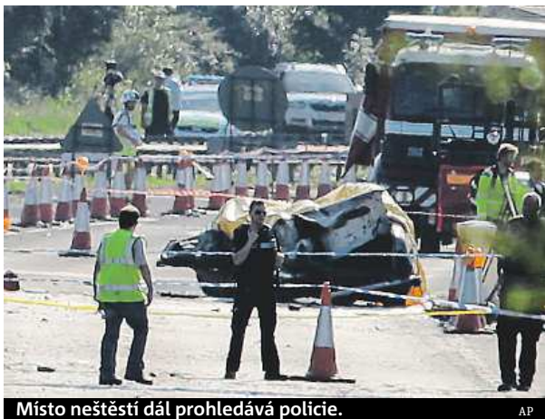
Místo neštěstí dál prohledává policie.

Jedním z postižených vozů byla podle listu The Telegraph svatební limuzína. Mezi potvrzené oběti patří dva fotbalisté hrající regionální soutěž. Britský premiér David Cameron vyjádřil rodinám obětí soustrast.