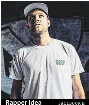
Rapper Idea FACEBOOK IF

Připravovali jsme ho asi rok a půl pomalu, ale zároveň koncentrovaně. Texty už jsem si ani moc nepsal. Půlka desky je z hlavy, kdy jsem si freestyloval a pak z velké změti slov skládal texty.