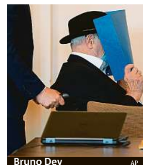
Bruno Dey

Podle prokuratury v době, kdy Dey ve Stutthofu sloužil, bylo v táboře nejméně 200 lidí zavražděno v plynové komoře a na pět tisíc dalších zemřelo kvůli nelidským podmínkám. Na začátku procesu loni v říjnu Dey