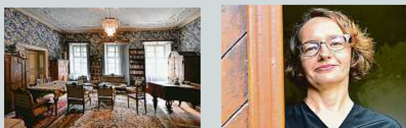
Statek slavného básníka a grafika B. Reynka