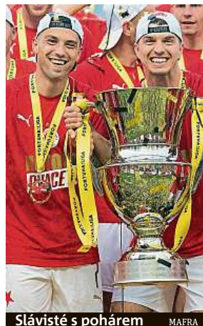
Slávisťe s pohárem MAFRA

Vedle utkání v Opavě se měly hrát ještě další dva duely předposledního čtvrtého kola šestičlenné skupiny o záchranu. I zápasy mezi Příbramí a Teplicemi a Zlínem s Karvinou však byly Ligovou fotbalovou asociací (LFA) odloženy.