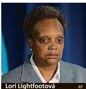
Lori Lightfootová

Starostka města nejprve odmítala, ale situace je natolik vyhrocená, že nakonec souhlasí.