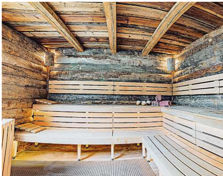
Kelosauuna je zbudovaná ze starých borovic, ve kterých je pryskyřice.