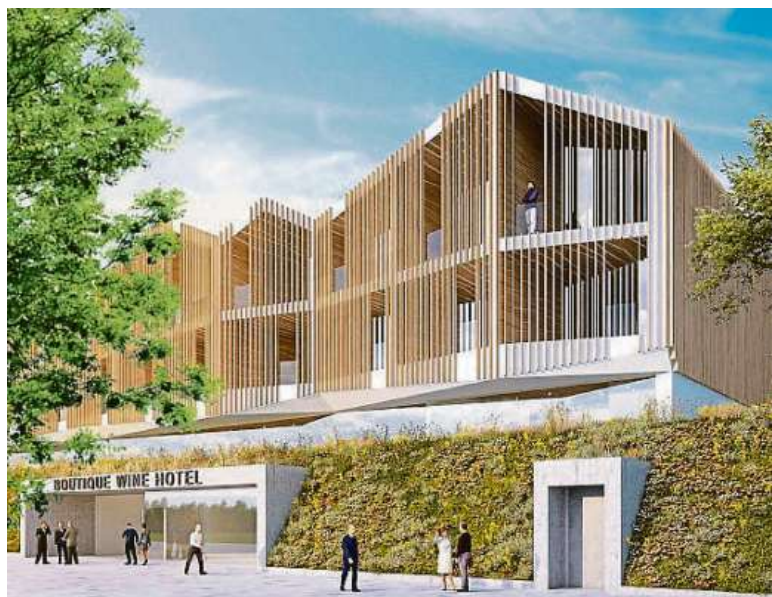
Takto má vypadat Boutique Wine Hotel v Mikulově.