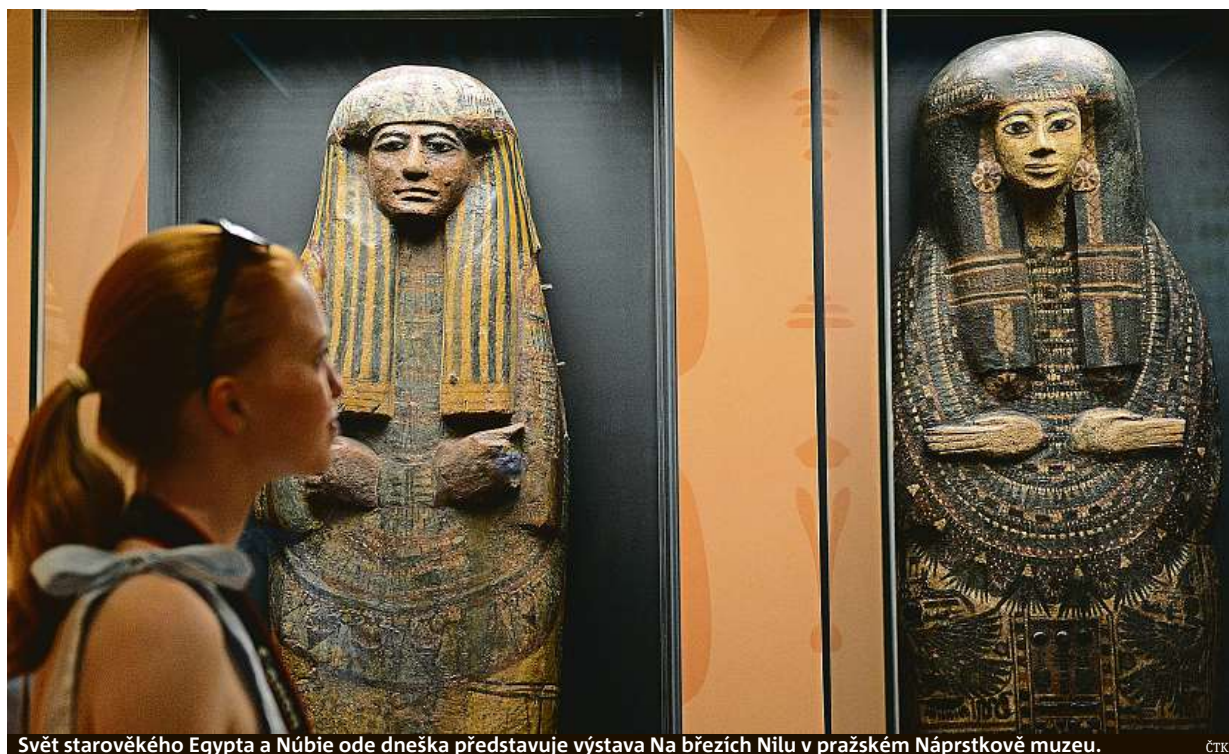
Svět starověkého Egypta a Nubie ode dneška představuje výstava Na březích Nilu v pražském Náprstkově muzeu.

Žloutenka typu C. Šíří se hlavně na drogové scéně, dřív se ale přenášela i transfuzemi. Zrádný zabiják. Nemoc se může projevit až po dvaceti či třiceti letech. Léčba. Největší úspěchy slaví ve věznicích STRANA 2