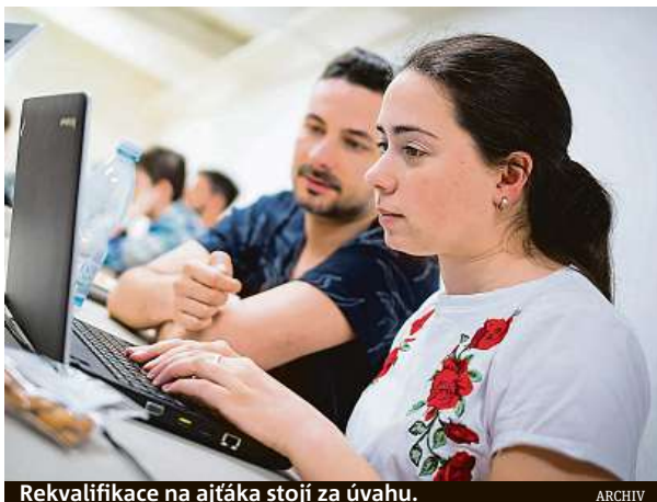
Rekvalifikace na ajťáka stojí za úvahu.