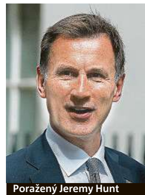
Poražený Jeremy Hunt

• V letech 2016 až 2018 byl ministrem zahraničí.