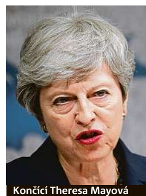
Končí Theresa Mayová