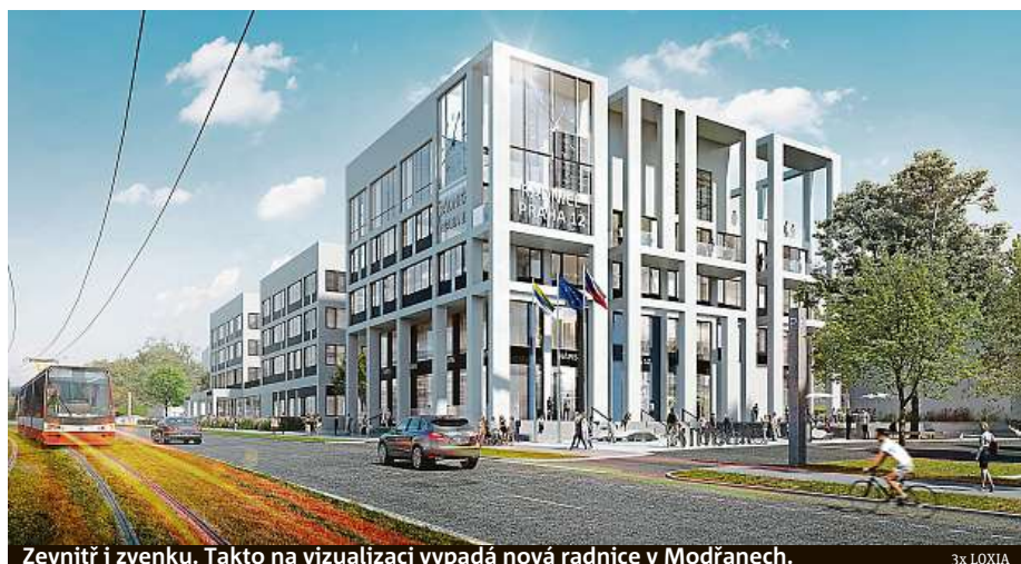
Zevnitř i zvenku. Takto na vizualizaci vypadá nová radnice v Modřanech.