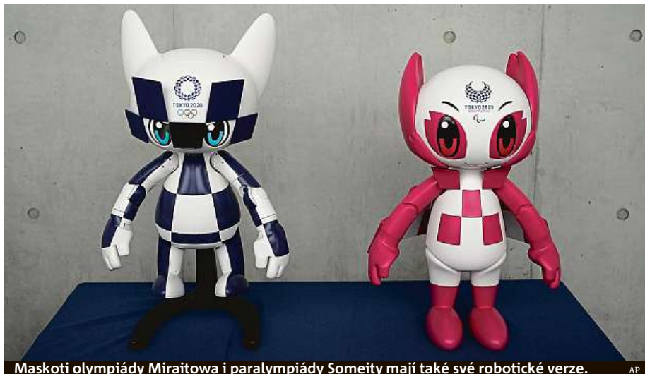
Maskoti olympiády Miraitowa i paralympiády Someity mají také své robotické verze.

Stavba za 1,25 miliardy dolarů (zhruba 28 miliard korun) vyrostla na místě arény, která hostila předchozí olym-