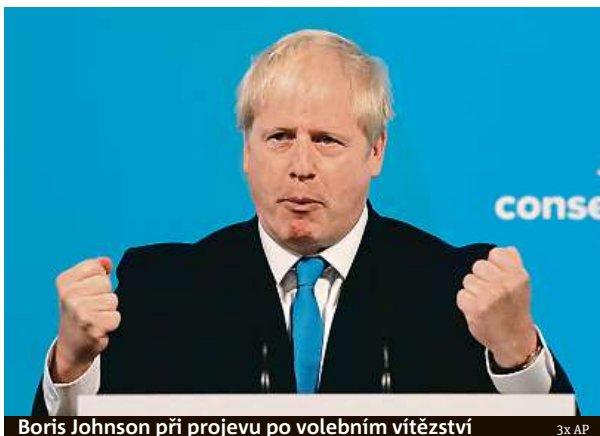
Boris Johnson při projevu po volebním vítězství

Johnson poděkoval svému rivalovi Jeremymu Huntovi, poraženému současnému šéfu diplomacie, a ocenil ho jako kvalitního soupeře. Johnsonovi dalo hlas 92 153 britských konzervativců, zatímco Hunt získal přízeň 46 656 hlasujících. Budoucí premiér ocenil rovněž odcházející šéfkou kabinetu Theresu Mayovou, která ve funkci končí kvůli neúspěchu své brexitové strategie.