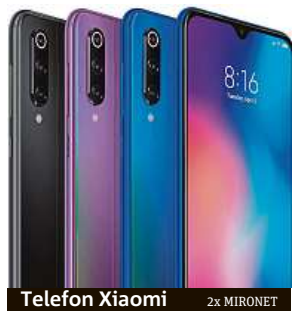
Telefon Xiaomi 2x MIRONET

S každou novou technologií, a na poli mobilních telefonů to platí dvojnásob, se opakuje určitý jev. Během relativně krátké doby tyto nové technologie pronikají z vlajkových lodí i do telefonů střední třídy a pomalu se stávají standardem. Pokud tedy například chcete nový telefon se čtečkou otisků prstů ukrytou v displeji, nemusíte už zaplatit ani 10 tisíc korun.