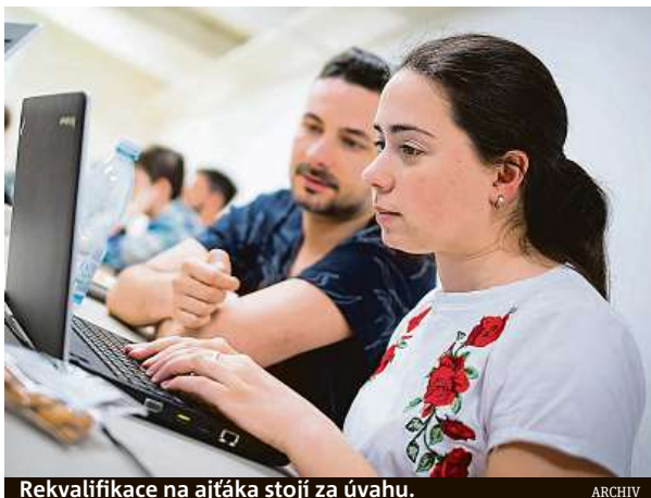
Rekvalifikace na ajťáka stojí za úvahu.