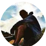
Zbyněk Štíber Psycho. Naprostě jednoznačně.