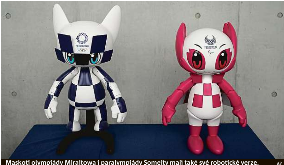
Maskoti olympiády Miraitowa i paralympiády Someity mají také své robotické verze.

Stavba za 1,25 miliardy dolarů (zhruba 28 miliard korun) vyrostla na místě arény, která hostila předchozí olym-