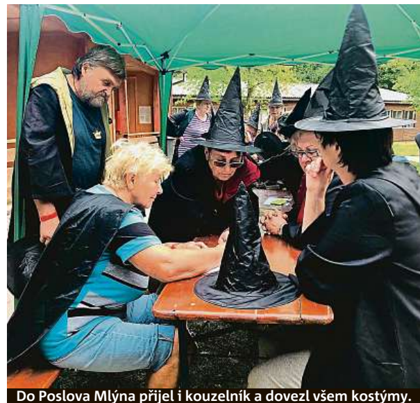
Do Poslova Mlýna přijel i kouzelník a dovezl všem kostýmy.

Na táborech pro seniory se zkrátka musí brát větší ohled