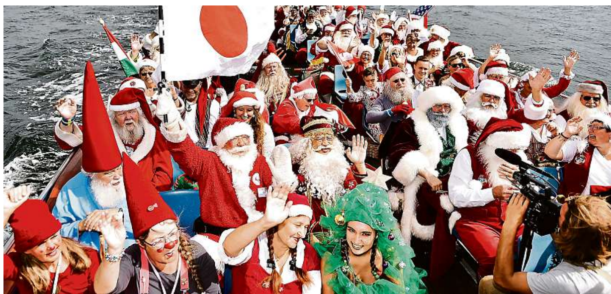
V Kodani se pět měsíců před Vánocemi koná tradiční mezinárodní santaklausovské soustředění.

Tábory pro důchodce. Hry, soutěže, výlety, táborák i karneval. Jiná pravidla. Povoleny jsou káva i cigárka, večerka je nepovinná. Účastníci. Někteří se hlásí sami, jiní dostanou pobyt jako překvapení od vnoučat STRANA 2