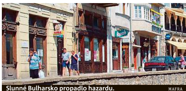
Slunné Bulharsko propadlo hazardu.

V Bulharsku jsou provozovatelé her soukromí a nemají žádné závazky, do určité míry ale sponzorují sportovní kluby. „Pozor, abychom sport nezabili!“ upozorňuje před možnými regulacemi stíracího hazardu legendární bulharský fotbalista Christo Stoičkov.