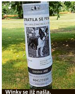
Winky se již našla.