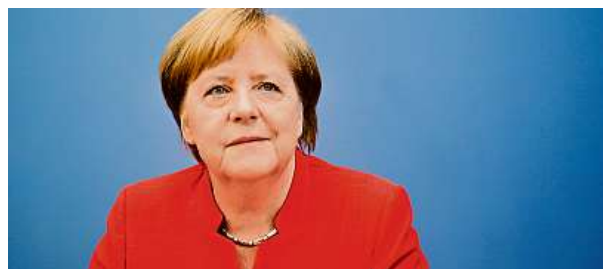
Angela Merkelová zaštiťuje program Trojitá výhra.