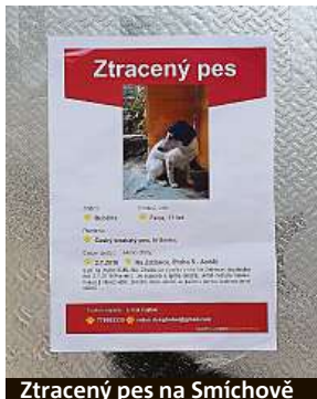
Ztracený pes na Smíchově