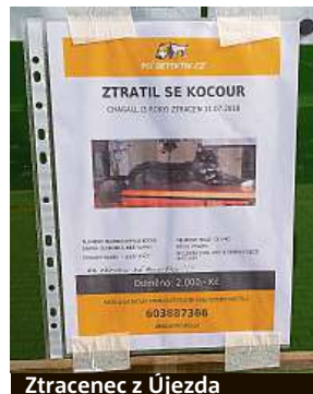
Ztracenec z Újezda