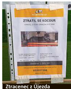
Ztracenec z Újezda