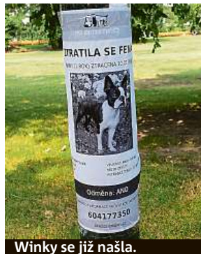
Winky se již našla.