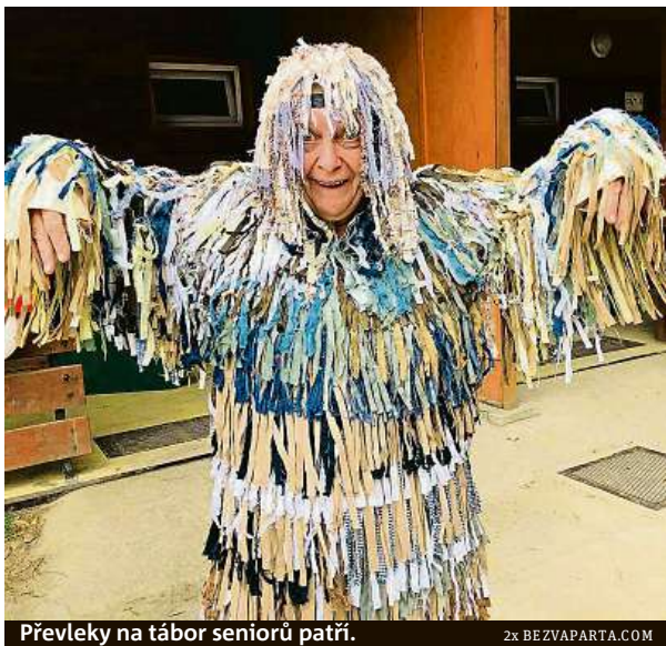
Převleky na tábor seniorů patří.

Tábor pro seniory je podobný i těm dětským. Hrají se