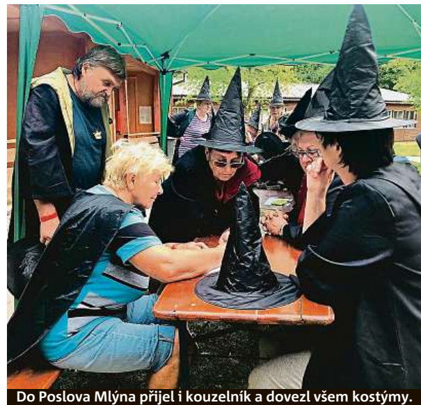
Do Poslova Mlýna přijel i kouzelník a dovezl všem kostýmy.

Na táborech pro seniory se zkrátka musí brát větší ohled