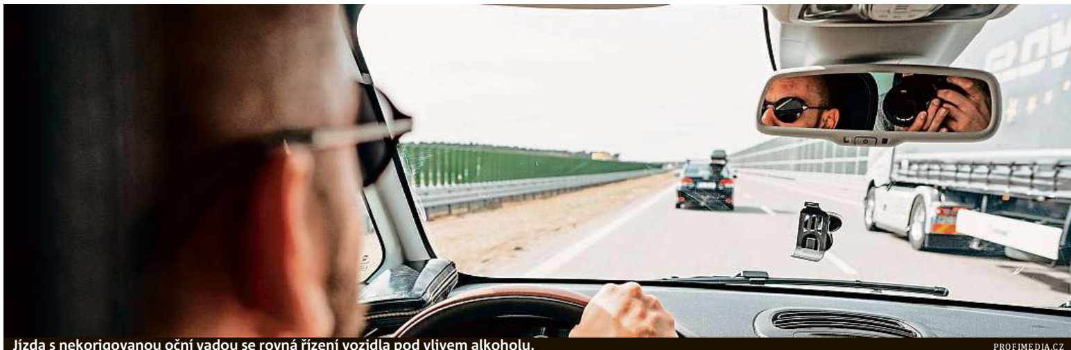
Jízda s nekorigovanou oční vadou se rovná řízení vozidla pod vlivem alkoholu.