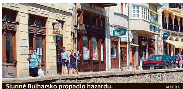
Slunné Bulharsko propadlo hazardu.

V Bulharsku jsou provozovatelé her soukromí a nemají žádné závazky, do určité míry ale sponzorují sportovní kluby. „Pozor, abychom sport nezabili!“ upozorňuje před možnými regulacemi stíracího hazardu legendární bulharský fotbalista Christo Stoičkov. ČTK