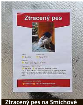
Ztracený pes na Smíchově