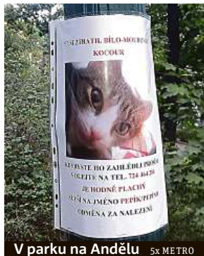
V parku na Andělu 5x METRO