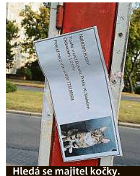
Hledá se majitel kočky.

V útulcích městské policie čekají na své páničky necelé tři stovky psů a koček.