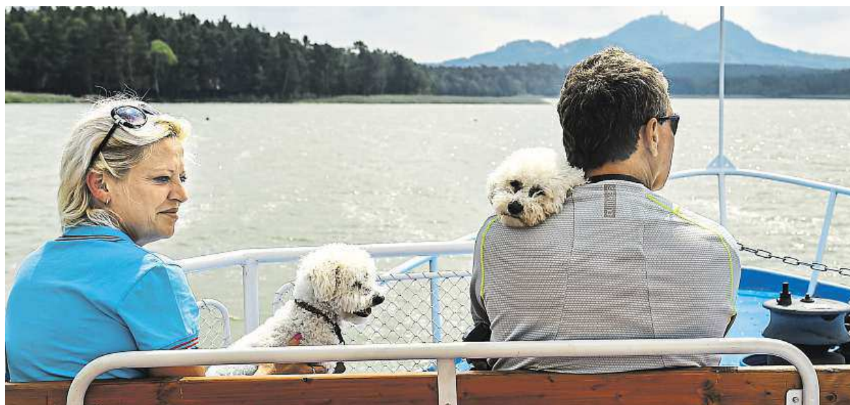
Mírně zhoršenou kvalitu vody kvůli výskytu sinic má Máchovo jezero. Na jeho hladinu letos poprvé vyplula výletní loď Máj. ČTK

Korupce. Soud s bývalým středočeským hejtmanem po roce a půl vynesl rozsudek. Další trest. Státu má propadnout zhruba 20 milionů z Rathova majetku. Reakce. Selhání ČSSD, adekvátní trest i fraška STRANA 6