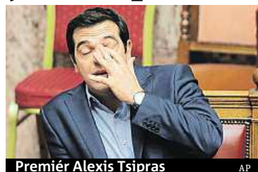
Premiér Alexis Tsipras

Podle listu Ta Nea bude Tsipras neúnavně bojovat za dosažení dohody s věřiteli a následně zúčtuje s opozicí ve vlastní straně. Řecká vláda bude na-