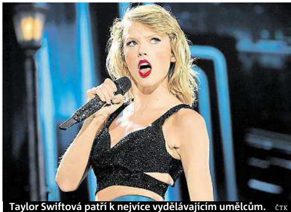
Taylor Swiftová patří k nejvíce vydělávajícím umělcům.

Countryová zpěvačka Swiftová patří k nejvíce vydělávajícím hudebním hvězdám na světě a v posledních letech získala množství hudebních ocenění. Turné po Číně, které stejně jako její nové al-