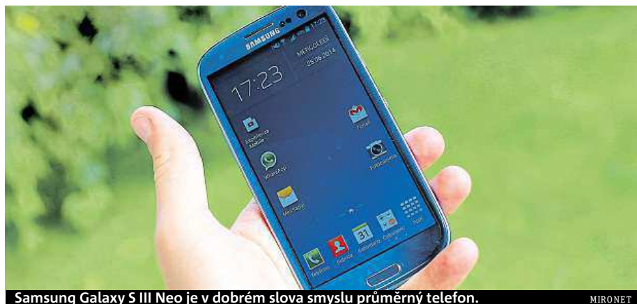
Samsung Galaxy S III Neo je v dobrém slova smyslu průměrný telefon.

Během tří let hardware této legendy sice zestárnul, ale pořád patří mezi dobře použitelný střed. Samsung se proto rozhodl slávu S III oživit přídomkem Neo. Jedná se prakticky o stejný telefon, změnil se jen výrobce procesoru a navýšila se operační paměť. Věřte nebo ne, pořád to většinou lidé stačí – pro ně jsou totiž důležitější syté barvy na AMOLED displeji, slušná výdrž na jedno nabití a kompaktní rozměry než nějaké gigaherty za jádra.