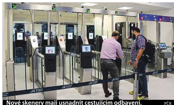
Nové skenery mají usnadnit cestujícím odbavení.

Novinku ocení hlavně ti, kteří létají mimo schengenský prostor a vlastní pas s biometrickými údaji. Fungování zařízení je jednoduché, cestující vloží cestovní doklad do čtecího zařízení, kde proběhne kontrola dat, poté přistoupí k bráně a pohyblivá biometrická kamera ověří obličej. Na tento automatický proces pouze dohlíží policista, který na monitoru počítače sleduje chování cestujícího, porovnává