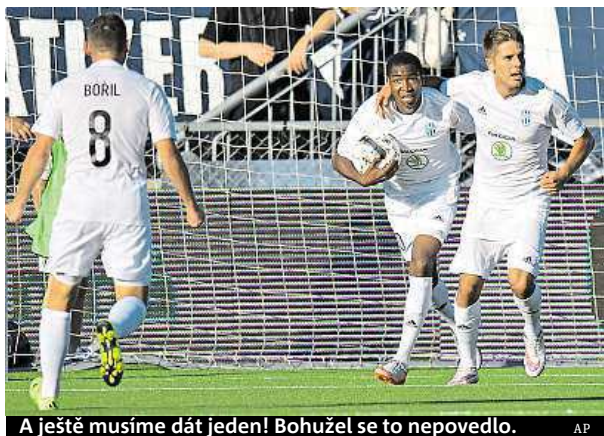
A ještě musíme dát jeden! Bohužel se to nepovedlo.

V úvodu druhé půle se Strömsgodset pustil do útoku a gólmána Veselovského vystrašil dvěma střelami levý bek Hanin. Vzápětí nebezpečně hlavičkoval Sörum, ale Veselovský skvěle vyrazil. Mladá Boleslav vydařenou pětiminutovku domácích přežila a mohla se znovu vrhnout za houbou o postupový gól. Ten se jí však přes několik slibných šancí vstřelit nepovedlo, a Strömsgodset tak uhájil postupový výsledek. ČTK