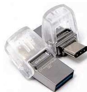
Klíčenka má 64 GB. MIRONET

Redukční kabely sice stojí pár korun, ale o pohodlné řešení se zrovna nejedná. Takový ocásek se plete, ztrácí a koleduje si o ulomení včetně portu na mobilu. Kingston si zřejmě řekl, že by byla škoda nepokusit se o zdařilejší nápravu a přispěchal s 64 GB klíčenkou DataTraveler microDuo 3C. Ta