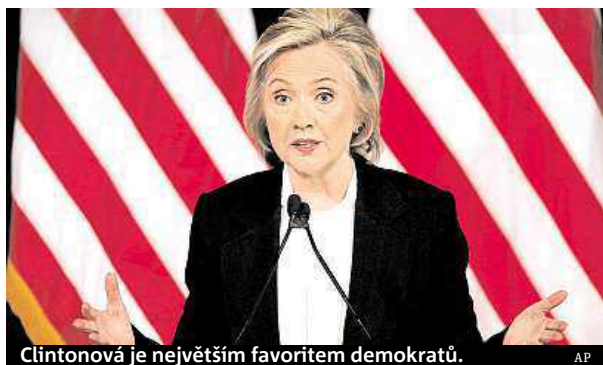
Clintonová je největším favoritem demokratů.

Nejnadějnější demokratická kandidátka v boji o úřad amerického prezidenta Hillary Clintonová by podle průzkumu neuspěla při střetu s republikánskými uchazeči ve státech Virginie, Colorado a Iowa. Jde přitom o jedny z takzvaných „swing states“, které nejsou tradičně ani republikánské, ani demokratické. Právě takové státy většinou rozhodují celé americké volby.