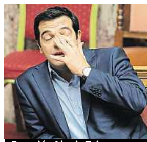
Premiér Alexis Tsipras

Řecká levicová formace Syriza, ze které vzešel nynější premiér Alexis Tsipras, je na pokraji rozštěpení. V reakcích na střední schválení druhého balíku reforem požadovaných mezinárodními věřiteli to uvádí řecký tisk. Podporu opatřením, jimiž věřitelé podmínili zahájení jednání s Aténami o další finanční pomoci, totiž opět odmítlo více než 30 členů