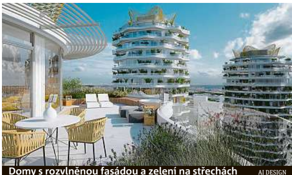
Domy s rozvlněnou fasádou a zelení na střeších AI DESIGN

„I když je tato nová podmínka UNESCO velmi specifická, nezbyvá než ji respektovat, aby se v místě mohlo stavět. Ale protože návrh rozvlněných věží není možné snížit, jelikož by stavby snížením zcela ztrácely své proporce, bude nyní ateliér Evy Jiříčné a Petra Vágnera návrh celé této lokality kompletně předělávat,“ řekl Dušan Kunov-