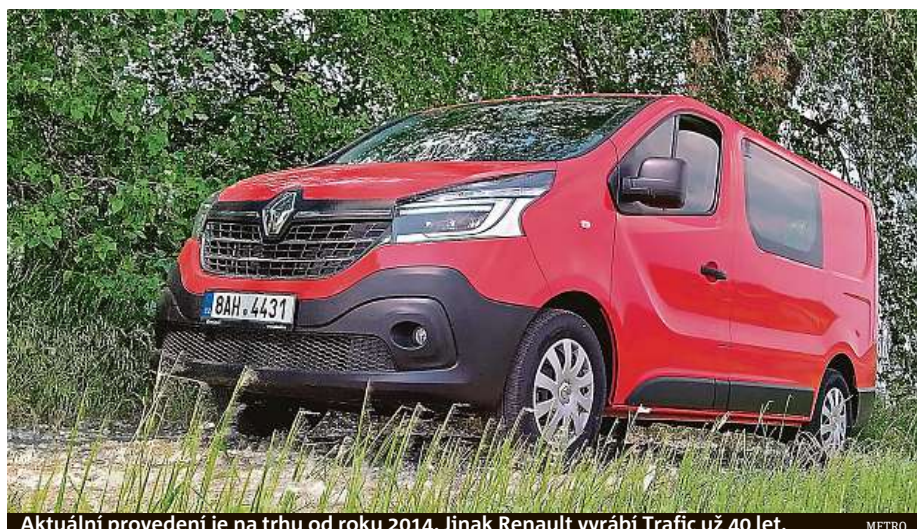
Aktuální provedení je na trhu od roku 2014. Jinak Renault vyrábí Trafic už 40 let.

ní verzi Trafic Combi Van, která se nabízí opět ve dvou délkách a se třemi výkonnostními verzemi dvoulitrového naftáku. Nejslabší 88kW motorizace, kterou jsme projeli, byla spojena s manuální šestistupňovou převodovkou. Ta řadila přesně a vůbec bylo řízení velmi příjemné. Třebaže to není auto na kdovíjak dynamickou jízdu, bylo těch 120 koní úplně dostačující. Velmi nás bavila ohromná porce dojezdových kilometrů – auto má 80litrovou nádrž a při spotřebě 7,5 litru na sto kilometrů bychom dojeli snad i na světa kraj. A v šesti lidech! Ceny za Trafic Combi Van startují na částce 746 900 korun. HOP