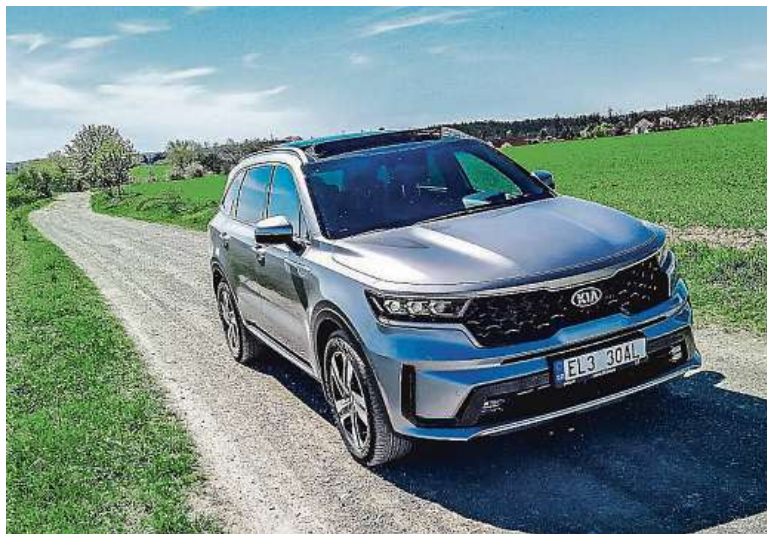
Čtyřkolka funguje perfektně, v lehkém terénu je jako doma.