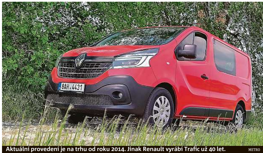
Aktuální provedení je na trhu od roku 2014. Jinak Renault vyrábí Trafic už 40 let.

ní verzi Trafic Combi Van, která se nabízí opět ve dvou délkách a se třemi výkonnostními verzemi dvoulitrového naftáku. Nejslabší 88kW motorizace, kterou jsme projeli, byla spojena s manuální šestistupňovou převodovkou. Ta řadila přesně a vůbec bylo řízení velmi příjemné. Třebaže to není auto na kdovíjak dynamickou jízdu, bylo těch 120 koní úplně dostačující. Velmi nás bavila ohromná porce dojezdových kilometrů – auto má 80litrovou nádrž a při spotřebě 7,5 litru na sto kilometrů bychom dojeli snad i na světa kraj. A v šesti lidech! Ceny za Trafic Combi Van startují na částce 746 900 korun. HOP