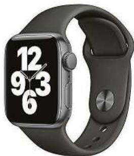
Apple Watch SE

Přišel čas Apple Watch SE, které zaujmou výkonným čipem, osvědčeným elegantním designem a všemi oblíbenými funkcemi, které tolik milujeme.