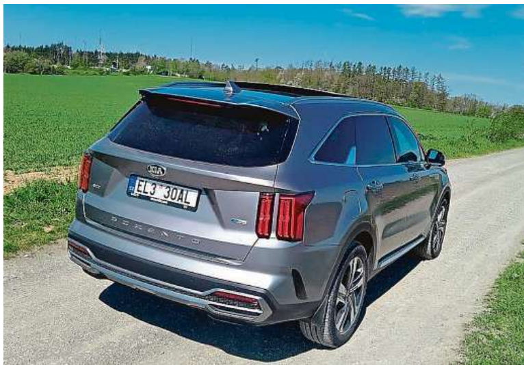
Zadní světla se podobají americkým SUV. Sorento to velmi sluší.