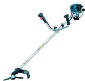
Makita EBH341U 2x MIRONET

EBH341U. Jde o praktického pomocníka, který vám umožní dokonale zastříhnout keře, trávník či menší dřeviny přesně podle vašich představ. Je poháněn čtyřtaktním motorem s obsahem 33,5 cm 3 a výkonem 1,07 kW s minimální spotřebou paliva a nízkými emisemi. S křovinořezem se snadno dostanete i do hůře přístupných míst.