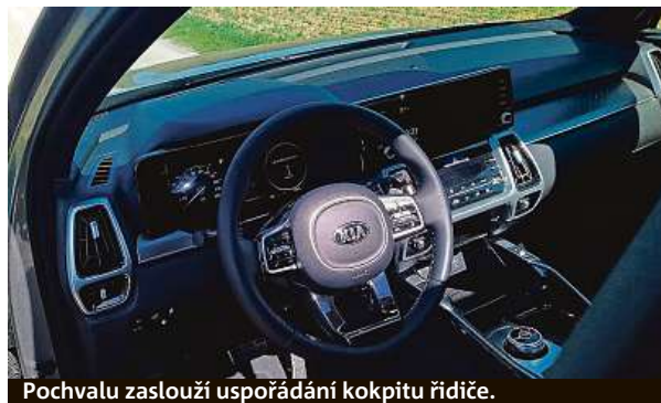
Pochvalu zaslouží uspořádání kokpitu řidiče.

Vlajkovou loď automobilky Kia lze nabíjet palubní nabíječkou o výkonu 3,3 kW, což je ideální do domácí zásuvky. Z ní se naplní akumulátor za 3,5 hodiny. PETR HOLEČEK