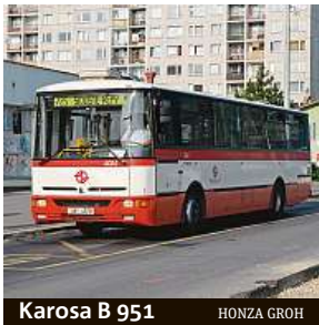
Karosa B 951 HONZA GROH

Sobotní akce bude zahájena v muzeu MHD ve Střešovicích. „Součástí bude průvod autobusů Prahou a doprovodný program na Výstavišti v Bubenči,“ řekla mluvčí DPP Aneta Řehková.