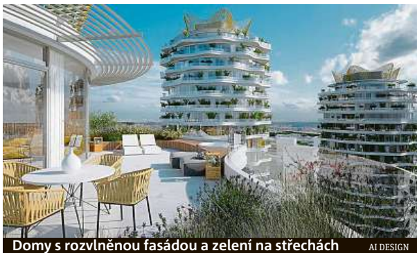
Domy s rozvlněnou fasádou a zelení na střechách