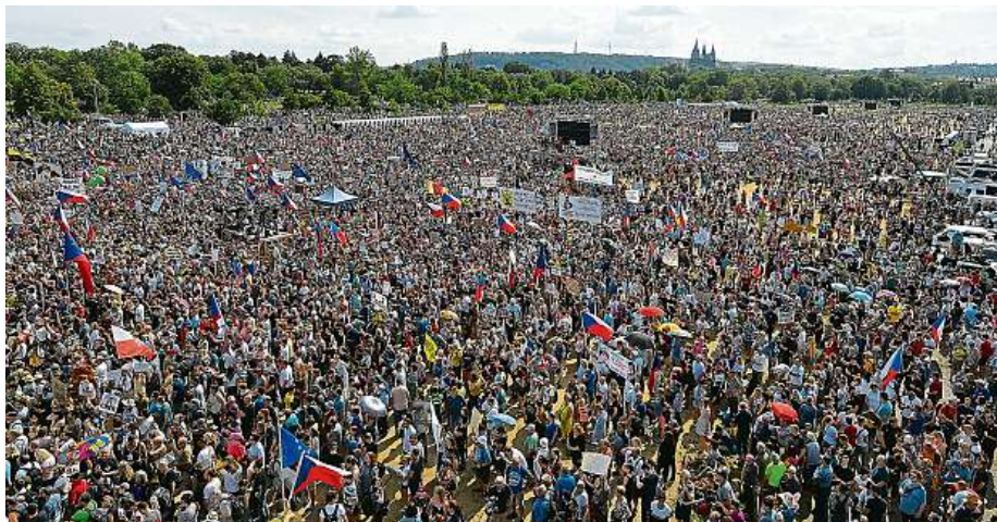
Začátek protestu na Letné (na snímku vlevo). Na něj lidé přišli s nejrůznějšími transparenty. Udělali si legraci i z Babišova slova „motýle“.