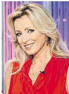
K. Brožová

Herečka a zpěvačka Kateřina Brožová se těší na léto, kdy bude mít konečně čas na sebe i své blízké. Částečně ale bude i pracovat. Se svým pořadem Exkluziv se vydala poprvé mimo studio a zítra večer pozdraví diváky TV Barrandov z vinného sklípku.